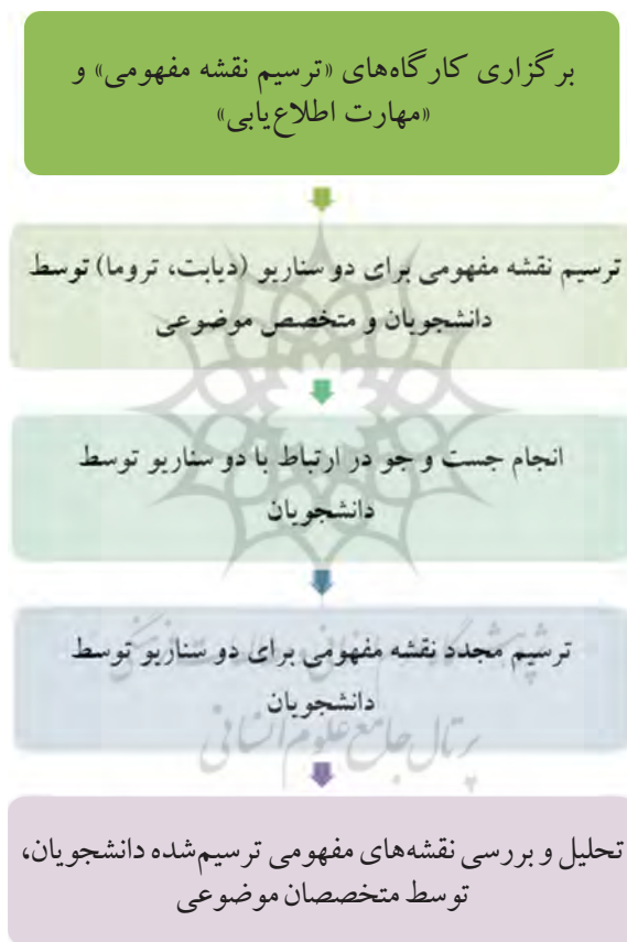
نمودار ۱. روند انجام پژوهش

پژوهش حاضر، نیمه‌تجربی و از نوع طرح تک‌گروهی پیش‌آزمون-پس‌آزمون بود و در سال ۱۴۰۰ انجام شد. روند انجام پژوهش در نمودار شماره ۱، نمایش داده شده است.