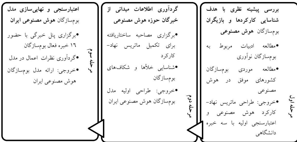
شکل ۱) فرآیند انجام پژوهش

از پژوهشگران مهمان خواسته شد تا مصاحبه‌های خبرگان را مورد تحلیل قرار دهند و با یافته‌های پژوهشگر هسته مقایسه و تطبیق داده شد و تطابق بالا را تأیید کرد. (د) تأییدپذیری (به جای عینیت) به معنای میزانی که نتایج پژوهش می‌توانند به وسیله سایر پژوهشگران تأیید شوند. نتایج پژوهش توسط سه پژوهشگر مدعو تأیید شد. تأثیرگذاری بالا با میانگین عدد ۳ با نارنجی تیره، تأثیرگذاری متوسط با رنگ نارنجی روشن و تأثیرگذاری کم با رنگ زرد نشان داده شده است. بازیگرانی که با نظر اکثریت خبرگان عدد ۱ را کسب نکردند، از فهرست بازیگران حذف شده و بدین معناست که به عنوان بازیگر اثرگذار در مرحله آغازین شکل‌گیری بوم‌سازگان مؤثر نیستند.