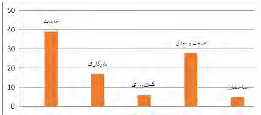
نمودار ۳. سهم بخش‌های مختلف اقتصادی از تسهیلات بانکی در ۹ ماهه سال ۱۳۹۹