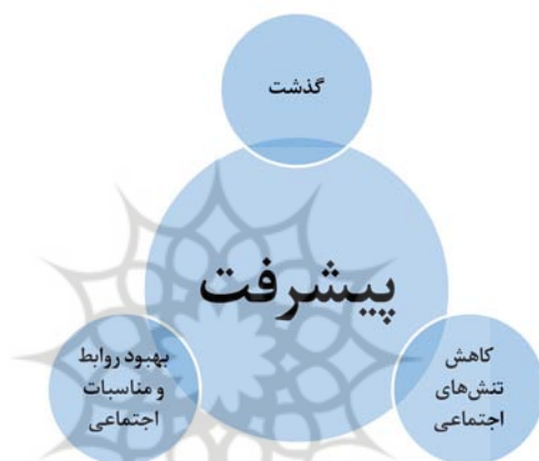
شکل ۳: رابطه کنش اخلاقی گذشت با پیشرفت

است. تداوم این وضعیت می‌تواند شرمساری شخص نابهنجار را در پی داشته باشد و موجب تصحیح رفتار او بدون ایجاد تنش شود؛ زیرا وجود تنش در جامعه با پیشرفت ناسازگار است. با این وصف، شایسته است همان‌گونه که خداوند نسبت به نابهنجاری‌های بندگانش گذشت دارد، آحاد جامعه نیز نسبت به کنش‌های نامطلوب هم‌نوعانشان چشم‌پوشی کنند تا از گسست روابط اجتماعی و انقطاع تعاملات جلوگیری شود؛ زیرا بهبود روابط و مناسبات اجتماعی می‌تواند باعث فراوانی تعاملات اجتماعی به منظور هم‌افزایی در مسیر پیشرفت شود.