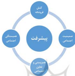
شکل ۲: رابطه کنش اخلاقی فروتنانه با پیشرفت

تعاون اجتماعی، سرازیر شدن نعمت‌های مادی و معنوی و بالاخره رشد و تکامل و پیشرفت جامعه است. بدین جهت است که خداوند به شخص پیامبر نسبت به کنش‌های فروتنانه در برابر مؤمنان فرمان می‌دهد (حجر/ ۸۸). این تعبیر، کنایه زیبایی از تواضع و محبت و ملاطفت است (همان: ۱۱/۱۳۲). با این شیوه رفتاری و الگوی عملی، امت سالم، متحد، مترقی، مهربان و صمیمی شکل می‌گیرد.