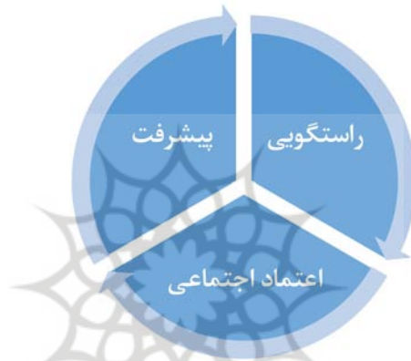
شکل ۱۰: رابطه کنش اخلاقی راستگویی با پیشرفت

نداشته باشند و دروغ در ارکان جامعه پدیدار شود، این مسئله در تقابل با سرمایه اجتماعی قرار می‌گیرد و باعث اختلال در وقوع پیشرفت خواهد شد. یک مطالعه صورت گرفته نشان می‌دهد که بی‌اعتمادی، تأثیر کاهنده‌ای بر روابط و پیوند اجتماعی داشته و این امر زمینه مناسبی برای انزوای اجتماعی افراد فراهم می‌آورد. بنابراین کم‌رنگ شدن اعتماد و حاکم شدن دروغ، سرمایه اجتماعی را از بین برده و نظام اجتماعی را مختل می‌سازد (امیرکافی، ۱۳۸۰). از دیگر سو، شواهد تجربی نشان می‌دهد که جوامع با سطح سرمایه اجتماعی بالاتر، پیشرفت سریع‌تری را تجربه می‌کنند (عسگری و توحیدی‌نیا، ۱۳۸۶: ۱۰۸).