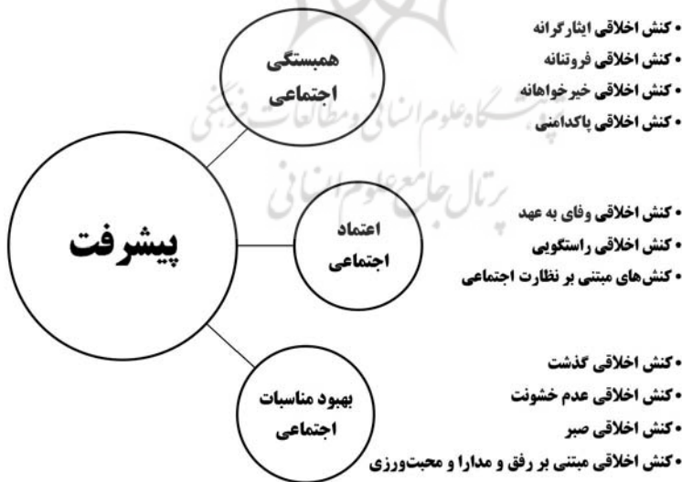
شکل ۱۱: رابطه کنش‌های اخلاقی با سازه‌های پیشرفت

روشن شد که سازهٔ پیشرفت، دست‌کم از سه مفهوم همبستگی اجتماعی، اعتماد اجتماعی و ارتباطات اجتماعی تشکیل شده است و هر یک از این مفاهیم و ابعاد سازهٔ پیشرفت با یک یا چند کنش اخلاقی مرتبط است. کنش‌های اخلاقی با یک واسطه یا چند واسطه، به تقویت و رشد همبستگی، اعتماد و ارتباطات اجتماعی در سطح جامعه منجر می‌شوند و به نوبهٔ خود، نقش مؤثری در پیشرفت دارند. شکل زیر تأثیرات کنش‌های اخلاقی را بر پیشرفت جامعه نشان می‌دهد.