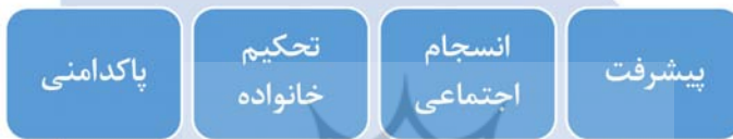
شکل ۸: رابطه کنش اخلاقی پاکدامنی با پیشرفت

اشاعه فحشا در جامعه، متعارض با پیشرفت جامعه است و آسیب آن می‌تواند مجموعه نهادهای جامعه را دستخوش تغییر کند و به تخریب جدی برخی از نهادهای اجتماعی منجر شود. شاید بتوان گفت که علت تحریم فحشا در جامعه، جلوگیری از شیوع آن در آحاد جامعه است؛ زیرا این گونه امور از بزرگ‌ترین موارد علاقه نفس است و نفس از محرومیت نسبت به آن‌ها طبعاً سخت ناراحت می‌شود. روشن است که شیوع فحشا باعث انقطاع نسل و فساد جامعه و خانواده می‌شود و با فساد خانواده‌ها، جامعه کبیر انسانی از بس. م. ۵۰۱ (طباطبائی، ۱۳۶۳: ۵۱۷/۷).