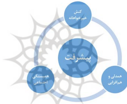
شکل ۷: رابطه کنش اخلاقی خیرخواهانه با پیشرفت

شود. نیکی و نیک‌خواهی برای دیگران، کانون اصلی و ویژگی خاص این نوع کنش است که نفع رساندن به دیگران را در پی دارد و در آیاتی به انجام آن تأکید شده است (مائده/۲). قرآن کریم به مؤمنان دستور می‌دهد که در کارهای نیک و خداپسندانه با یکدیگر همکاری و تعاون داشته باشند و برای انجام کارهای پسندیده و اعمالی که موجب پیدایش تقوا می‌شود، همدیگر را یاری کنند، ولی در ارتکاب گناه و در دشمنی و عداوت با یکدیگر همکاری نکنند؛ زیرا قرآن در پی آن است که روح تعاون را در جامعه اسلامی گسترش دهد. روشن است که اگر در میان افراد یک جامعه، روح تعاون حاکم شود، زمینه پیشرفت مادی و معنوی آن جامعه فراهم شده و تعاون و همکاری، بستر مناسبی برای ترقی و تعالی و شکوفایی همه‌جانبه آن جامعه می‌گردد (جعفری، ۱۳۷۶: ۳/۶۲-۶۳).