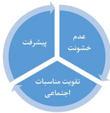
شکل ۶: رابطه کنش اخلاقی عدم خشونت با پیشرفت

عقل و کنترل احساسات خود را از دست می‌دهد که ناپسند و مذموم است (توبه/ ۵۸-۵۹؛ انبیاء/ ۸۷؛ رک: معماری، ۱۳۹۴).