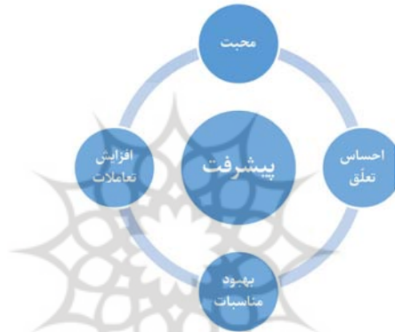
شکل ۴: رابطه کنش اخلاقی محبت با پیشرفت

مشرکان پس از پذیرش دعوت پیامبران، برادر مؤمنان معرفی شده‌اند (توبه/ ۱۱). این امتیاز باعث بهبود روابط بین نوگرویدگان و جامعه مسلمین شده و نتیجه آن هم‌افزایی بین ایشان به منظور دستیابی به جامعه‌ای کمتر آسیب‌دیده با هدف وصول به پیشرفت‌های ترسیم‌شده است.