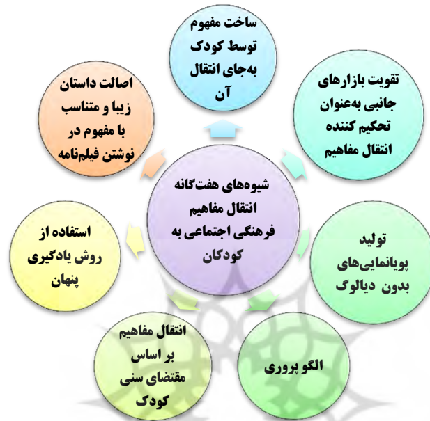
شکل ۳- شیوه‌های هفت‌گانه انتقال مفاهیم فرهنگی اجتماعی به کودکان