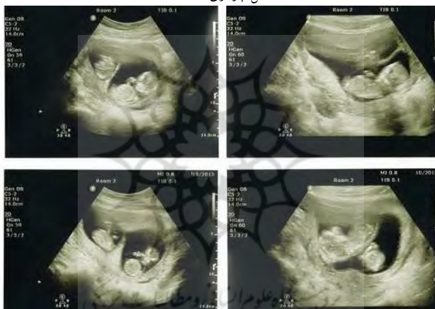
شکل: بارداری مضاعف

در باره دلیل بارداری مضاعف چنین گفته شده است: «معمولاً هنگامی که زن باردار می شود چندین فرایند بیولوژیکی به وجود می آید که مانع از بارداری مجدد در دوران بارداری می شود: بدن او هورمون هایی را که جلوی آزاد شدن تخمک از تخمدان ها می شود را آزاد می کند. «پلاگین مخاط» در دهانه رحم ایجاد می شود که مانع از حرکت اسپرم به داخل رحم می شود. دیواره رحم ضخیم می شود و کار برای لانه گزینی جنین دیگر مشکل می شود. اما در وضعیت های بسیار نادر با حامله شدن باز هم تخمک گذاری می تواند ادامه یابد و تخمدان های فرد، تخمک دیگری را آزاد کنند که قابلیت باروری دارند و در نتیجه آن بارداری دوم است، اما این دو جنین با سنین حاملگی مختلف به طور معمول فقط چند هفته با هم فاصله دارند که با دوقلوهای برابر متفاوت است که در آن دو تخم به طور هم زمان بارور می شوند و جنین ها سن حاملگی