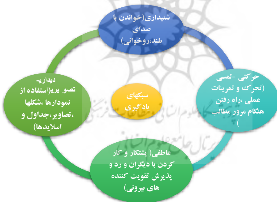
جدول شماره ۱. سبکهای یادگیری و علایق