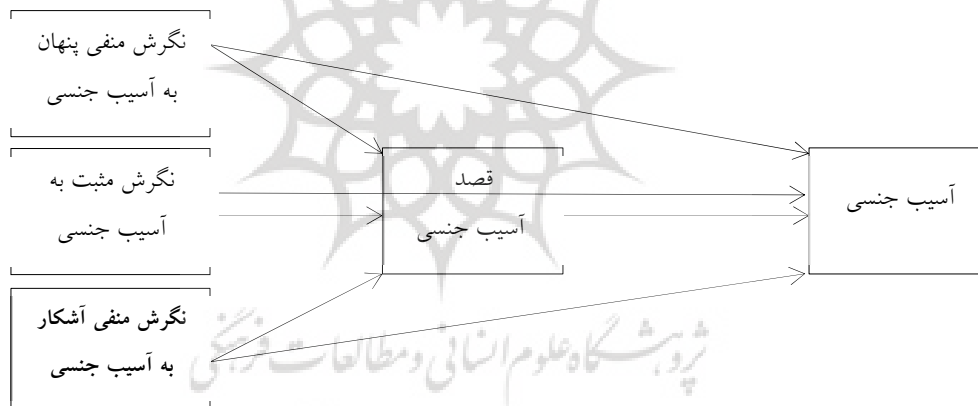
شکل 1. مدل مفهومی پژوهش

آسیب جنسی در محیط کار به عنوان شکلی از رفتار منفی به دلیل پیامدهای منفی و فراگیر آن، به عنوان یک مسئله مهم اجتماعی نیازمند انجام پژوهش‌های متعدد در جهت شناسایی عوامل بروز و یافتن راه‌حل‌های علمی دقیق برای پیشگیری آن است. مطالعه آسیب جنسی بر اساس نظریه علوم رفتاری به خوبی می‌تواند شناخت ما را از عواملی که باعث بروز این رفتار می‌گردد، افزایش دهد. از آنجا که براساس جستجوهای انجام گرفته در پایگاه‌های معتبر علمی همچون Magiran.com, Pubmed.com, Google Scholar, Science Direct و... پژوهشی که در این حوزه و از چنین منظری انجام گرفته باشد، یافت نگردید، ضرورت انجام چنین پژوهشی احساس شد. بنابراین، پژوهش حاضر دو محور اصلی را در این مطالعه در پی گرفته است. اول اینکه بتواند شکاف تحقیقاتی و نیاز جامعه را براساس متغیرهای پژوهش مورد تحقیق قرار دهد. علاوه بر این، سهم دیگر این مطالعه در گسترش دانش این حوزه، معرفی متغیر قصد آسیب جنسی و بررسی نقش این متغیر بر رفتار است. ضرورت دوم، ارائه راهکارها در جهت پیشگیری از بروز و گسترش رفتارهای آسیب‌رسان در محیط کار می‌باشد؛ به نحوی که از اطلاعات به دست آمده، در تدوین برنامه‌های پیشگیرانه از جمله آموزش تعریف آسیب جنسی و نحوه برخورد مسئولین با آن، فرهنگ‌سازی در جهت تغییر نگرش به آسیب جنسی و ایجاد سیاست‌هایی که بتوان از بروز این رفتار جلوگیری کند، استفاده گردد. بنابراین، هدف پژوهش حاضر پاسخ‌گویی به این سوالات است که آیا بین ابعاد نگرش به آسیب جنسی و آسیب جنسی رابطه وجود دارد؟ و آیا ابعاد نگرش به آسیب جنسی به واسطه نقش میانجی‌گری قصد آسیب جنسی منجر به آسیب جنسی می‌شود؟ بر این اساس، الگوی مفهومی پژوهش همان‌گونه که در شکل (1) مشاهده می‌شود، تدوین گردید.