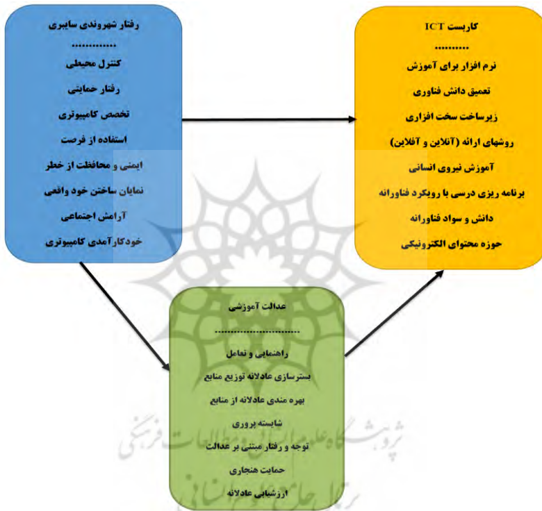
شکل ۳- مدل رابطه رفتار شهروندی سایبری با کاربرد فناوری اطلاعات و ارتباطات در آموزش با میانجیگری عدالت آموزشی

ج) در مبحث تعیین مولفه‌ها به لحاظ میزان تاثیرپذیری هر مولفه در قیاس با سایر مولفه‌ها، برنامه‌ریزی درسی با رویکرد فناورانه با مقدار R-J برابر با 1/0.52 - دارای اولویت اول و آموزش نیروی انسانی با مقدار R-J برابر با 1/4.05 دارای اولویت آخر در میزان تاثیرپذیری مولفه‌ها می‌باشد. در نهایت با توجه به نتایج حاصله، از سه بخش کیفی - کمی - اولویت‌بندی، مدل نهایی بشرح زیر ارائه گردید: