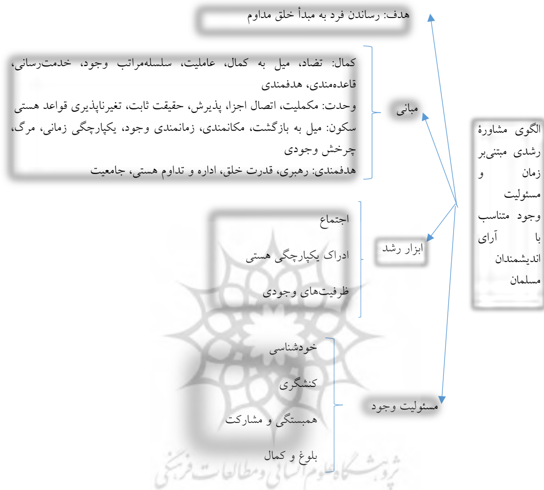
شکل ۱. نمای الگوی مشاوره رشدی با تأکید بر سیر زمانی رشد و مسئولیت فرد از منظر اندیشمندان مسلمان