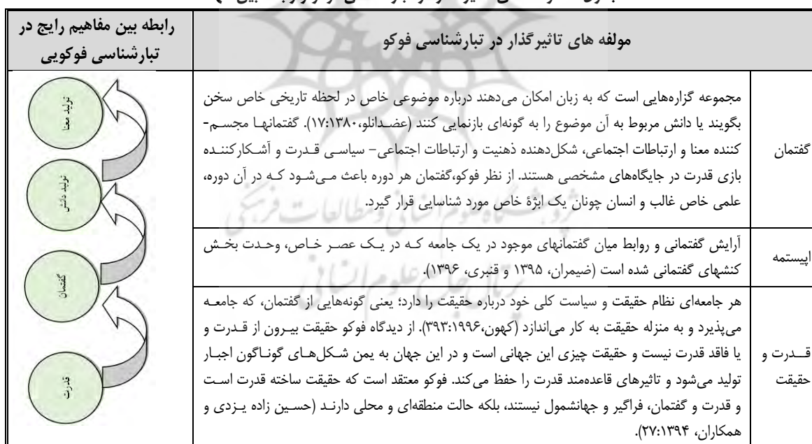
جدول ۱. مولفه‌های تأثیرگذار در تبارشناسی فوکو و رابطه بین آنها

میشل فوکو در روش تاریخی خود با طرح انقطاع در تاریخ از پدیده‌هایی که به واسطه استمرار تاریخی‌شان مشروعیت داشتند، مشروعیت‌زدایی کرده است و به این نکته اشاره نموده که ارزش‌ها سرشت ذاتی ندارند، بلکه با نیروها و مصالح تاریخی خلق شده‌اند و طی زمان تغییر می‌کنند (اسپینکز، ۲۰۰۳). او در روش تبارشناسی به اقتضای رویکرد علمی خویش، نموده‌های واقعیت را به میانجی مناسب‌هایی که با دیگر نمونها دارند بررسی و سیر آنها را از حال به گذشته دنبال می‌کند؛ یعنی به دنبال تاریخ واژگون است؛ نه آنکه پژوهش خویش را از گذشته آغاز کند و سپس به زمان حال سیر نماید؛ او راه خویش را از حال به گذشته پیوند می‌دهد؛ از این روست که از روش تبارشناسی سود می‌جوید. در این دیدگاه هیچگونه قاعده و قانون بنیادی و غیر قابل تغییر وجود ندارد و چون فلسفه به پایان خود رسیده است هرگونه قاعده، تعبیری محسوب می‌شود که قدرت‌مداران در سایه نظام گفتمانی خویش به آن ارزش و کارمایه عملی بخشیده‌اند. از دیدگاه فوکو مولفه‌های تأثیرگذار در تبارشناسی عبارتند از: گفتمان، اپیستمه، قدرت و حقیقت که در جدول ۱ نشان داده شده است.