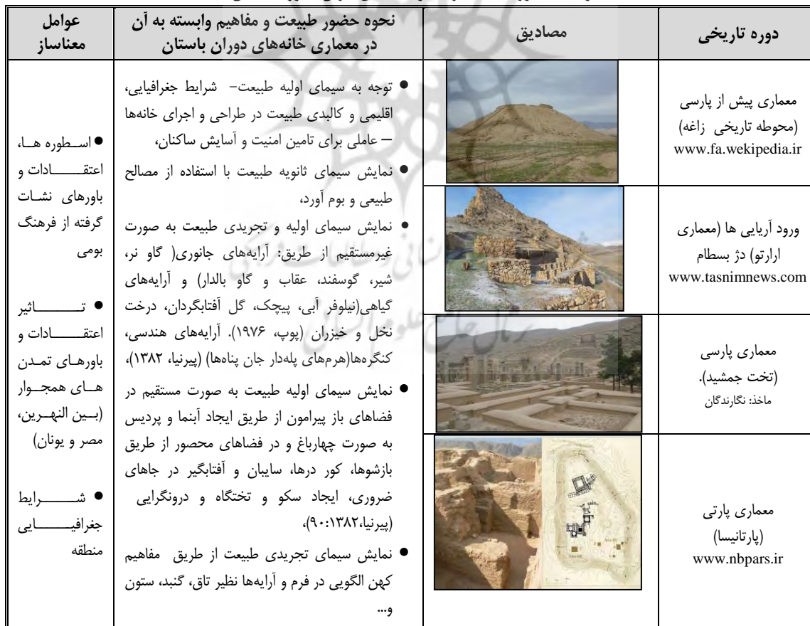
جدول ۳. حضور طبیعت در سکونتگاه‌های ایران - دوره باستان