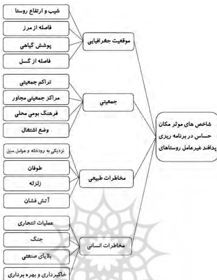
شکل ۱. درخت سلسله مراتب عوامل مؤثر مکان حساس در برنامه ریزی پدافند غیرعامل روستاهای مرزی استان اردبیل