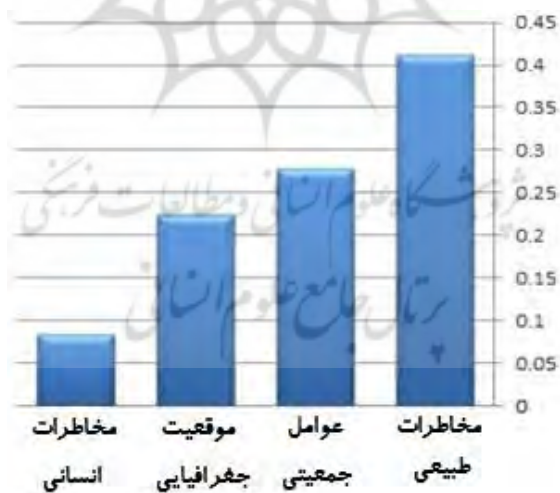
شکل ۳. نمودار اوزان نهایی معیارها

با توجه به اوزان نهایی معیارها و زیرمعیارها (جدول شماره ۶) می توان عوامل مؤثر مکان حساس در برنامه ریزی پدافند غیرعامل روستاهای مرزی استان اردبیل را اولویت بندی نمود. شکل شماره ۳ و ۴ نمودار میله ای اوزان نهایی مربوط به معیارها و زیر معیارها را نشان می دهد.