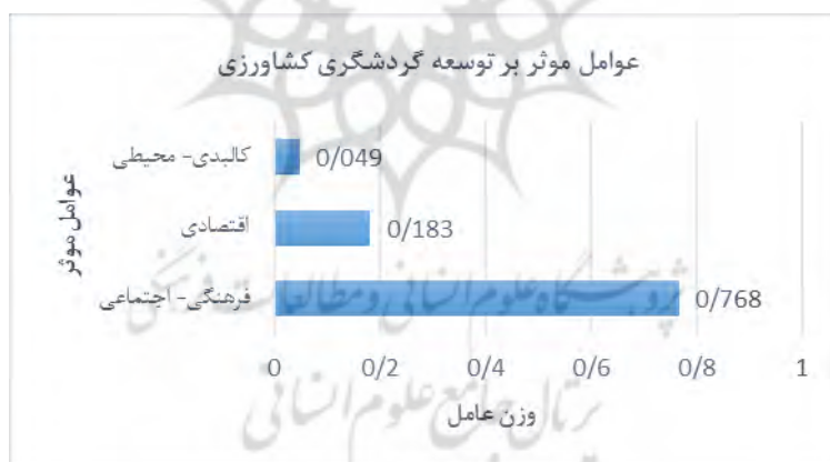
شکل ۲. رتبه بندی عوامل بر توسعه گردشگری کشاورزی (FAHP)

با توجه به نتایج پژوهش، از بین سه دسته عوامل فرهنگی- اجتماعی، اقتصادی و کالبدی محیطی با توجه به نظر پاسخگویان، عوامل فرهنگی - اجتماعی با ۷۷ درصد در رتبه اول، عامل اقتصادی با ضریب تأثیر ۱۸ درصد و عوامل کالبدی - محیطی با ضریب تأثیر ۵ درصد در رتبه آخر قرار گرفته‌اند (نمودار ۱).