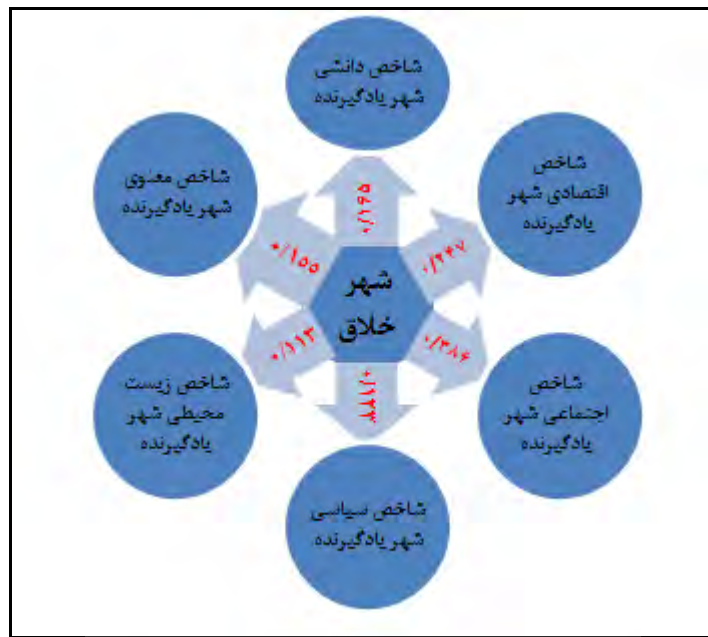
شکل ۳. مدل تجربی تأثیر شاخص‌های شهر یادگیرنده بر شهر خلاق