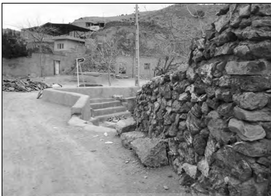
شکل ۵. تصویری از شاخص کالبدی روستای خراشاد در قبل از اجرای طرح

فرض ۳: میزان موفقیت اجرای طرح هادی روستای خراشاد با شاخص‌های کاربری اراضی در ارتباط است. H_0 : میزان موفقیت اجرای طرح هادی روستای خراشاد با شاخص‌های کاربری اراضی در ارتباط نیست. H_1 : میزان موفقیت اجرای طرح هادی روستای خراشاد با شاخص‌های کاربری اراضی در ارتباط است.