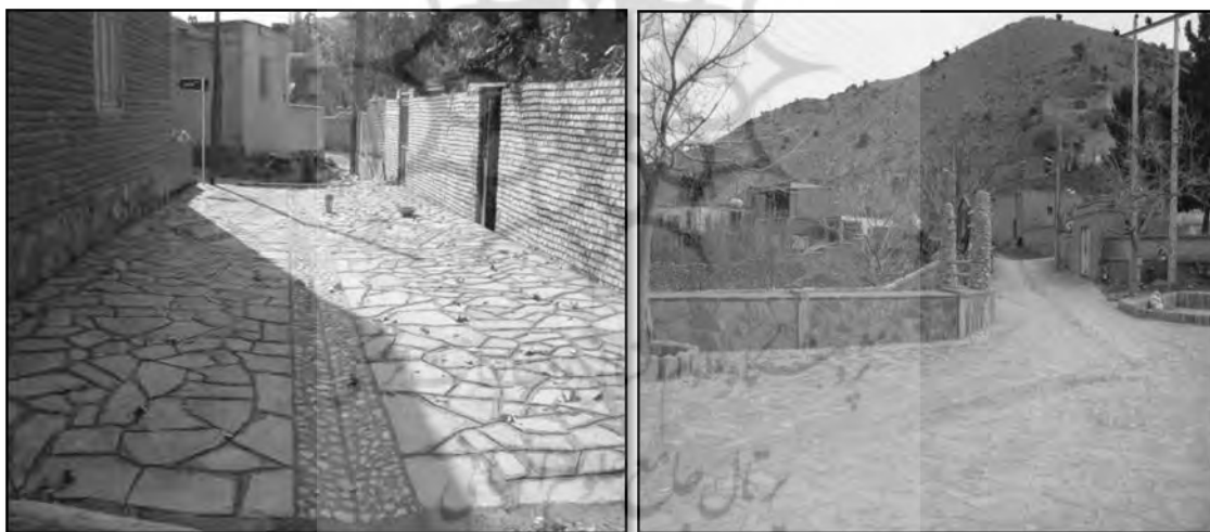
شکل ۴. تصاویری از شاخص کالبدی روستای خراشاد در بعد از اجرای طرح