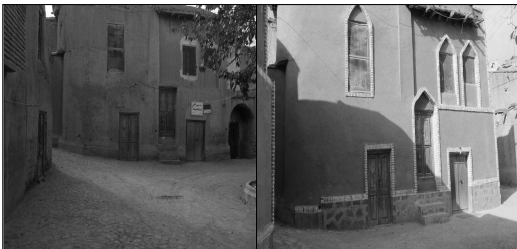
بعد از اجرای طرح شکل ۳. مسکن روستای خراشاد در قبل و بعد از اجرای طرح قبل از اجرای طرح

فرض ۲: میزان موفقیت اجرای طرح هادی روستای خراشاد با شاخص‌های شبکه معابر در ارتباط است. H_0 : میزان موفقیت اجرای طرح هادی روستای خراشاد با شاخص‌های شبکه معابر در ارتباط نیست. H_1 : میزان موفقیت اجرای طرح هادی روستای خراشاد با شاخص‌های شبکه معابر در ارتباط است.