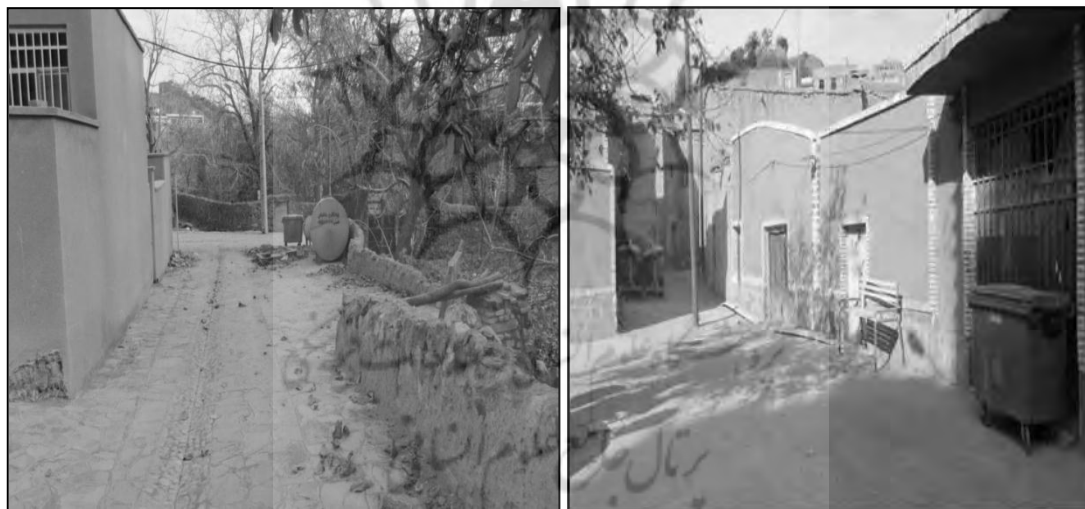
شکل ۶. تصاویری از شاخص بهداشت روستای خراشاد

یکی دیگر از شاخص‌های ارزیابی طرح‌های هادی، بهداشت محیط روستاهاست. آب‌گرفتگی و گل‌آلود شدن معابر در زمان بارندگی، عمده‌ترین مشکل معابر روستاهاست. بنابراین ایجاد آبرو (کانیو) و جدول‌گذاری معابر برای هدایت آب‌های سطحی به بیرون از بافت فیزیکی، هدایت و همچنین ساماندهی دفع زباله و دفع پساب‌های خانگی از جمله آثار بهداشت محیط روستاست که پس از اجرای طرح هادی قابل توجه است (Anabestani & Akbari, 2011:102). به همین دلیل یکی از اثرات اجرایی مورد انتظار از طرح هادی روستایی تأثیر بر روی بهداشت محیط و وضعیت زیست محیطی روستاهاست (Azimi & Jamshidian, 2004:30). با توجه به جدول مهمترین تأثیر طرح هادی در مورد شاخص‌های بهداشت بر روی دفع و هدایت آب‌های سطحی با 37/5 درصد است. قبل از اجرایی شدن طرح هادی، زباله‌های خانگی و فاضلاب و پس آب‌های خانگی، اغلب در سطح معابر رها می‌شدند ولی بعد از اجرایی شدن طرح، با نصب سطل زباله در سطح روستا و تهیه ی خودرو جهت جمع‌آوری زباله یکی از اقدامات مثبت طرح هادی در جهت جمع‌آوری و دفن زباله بوده است و علاوه بر آن، دفع و هدایت آب‌های سطحی در روستا نیز انجام می‌گیرد (شکل ۶).