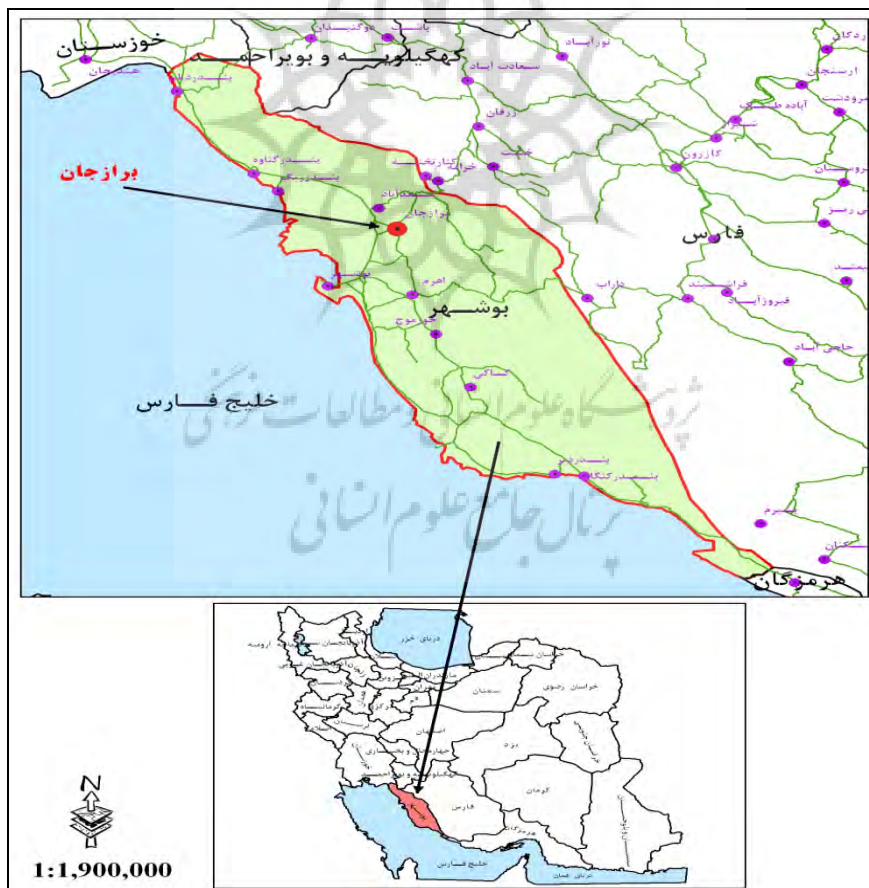
شکل ۱. موقعیت جغرافیایی محدوده مورد مطالعه در تقسیمات کشوری

شهر برازجان مركز شهرستان دشتستان در طول جغرافيايي ۵۱/۱۳ شرقي و عرض جغرافيايي ۲۹/۱۶ شمالي قرار گرفته و ارتفاع متوسط آن از سطح دريا ۱۳۰ متر مي‌باشد. برازجان در فاصله ۶۵ كيلومتری شمال شرقي بوشهر در مسير جاده بوشهر- شيراز قرار گرفته كه از شمال به شهرهاي کنار تخته و خشت و از جنوب به اهرم و رودخانه اهرم، از شرق به رشته كوه‌هاي گيسكان و از غرب به خليج فارس محدود مي‌شود (جودت و همكاران، ۱۳۶۶: ۱۱۴). شهر برازجان با وسعت ۱۴۸۵/۳۵ هكتار در سال ۱۳۹۰ داري ۹۵۴۴۹ نفر جمعيت، ۲۳۹۱۴ خانوار و ۲۲۰۲۹ واحد مسكوني بوده است (سازمان مديريت و برنامه‌ريزي استان بوشهر، ۱۳۹۰).