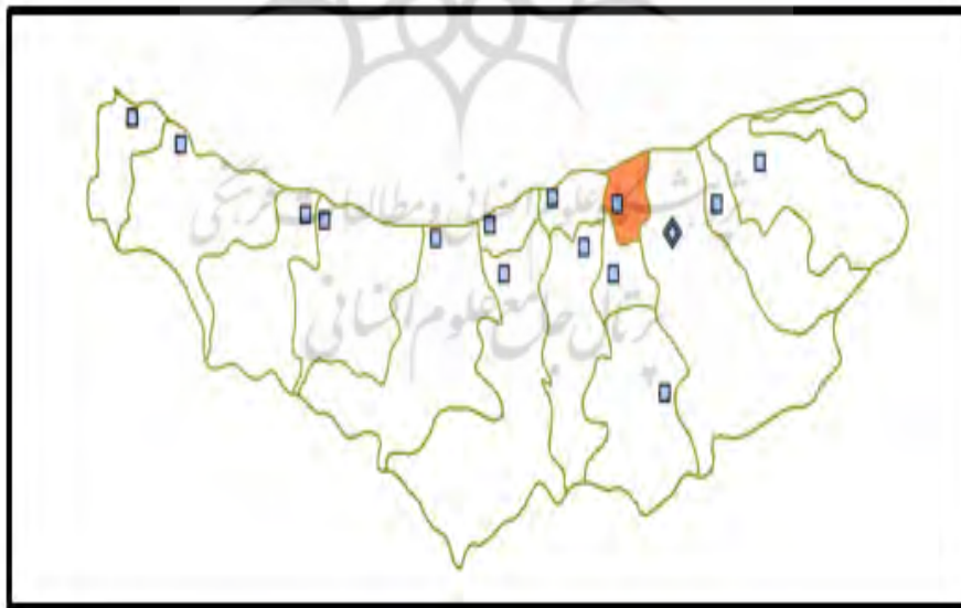
شکل ۱. موقعیت شهرستان جویبار در استان مازندران

محلات شهر با مفهوم سنتی و با تأکید اجتماعی آن عبارتند از: سراج کلا، فقیه محله، بالا محله، کرد محله، باغبان محله، کلاگر محله، تازه‌آباد، حیدرآباد و شهرک سپاه. شایان ذکر است حیدرآباد روستایی است که به شهر جویبار متصل شده است و شهرک سپاه اصولاً فاقد هویت محله‌ای است و از نقاط سکونتی است که به صورت منظم تفکیک شده و خارج از ضوابط قانونی ساخت و ساز شده است. گفتنی است که عموماً محلات شهر، دارای هسته اولیه روستایی بوده و به تدریج به هسته‌ی اولیه شهر متصل شده‌اند و مراکز نسبتاً قوی در سراج کلا و کلاگر محله قدمت و هویت این محلات را نشان می‌دهد. از نظر مراکز محله‌ای و الگوی شبکه، وضعیت محلات تا حدودی متفاوت می‌باشد. مراکز محله، کلاگر محله و سراج کلا از شکل قطبی-محوری پیروی می‌کند در حالیکه مرکز محلاتی نظیر: فقیه محله، تازه‌آباد و حیدرآباد محوری است، محلاتی نظیر بالا محله، باغبان محله دارای مرکزیت کوچک تا حدودی قطبی می‌باشد، برخی از محلات نظیر کرد محله و جوان محله و تاحدودی تازه‌آباد مراکز آن‌ها دارای حاشیه محلات و با مرکز شهر در هم تنیده است (سازمان مسکن و شهرسازی استان مازندران، ۱۳۸۲: ۱۳۹). شکل (۱) موقعیت شهرستان جویبار را در بین شهرستان‌های استان مازندران و شکل (۲) شهرستان جویبار را نشان می‌دهد.