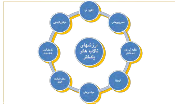
شکل ۱. ارزش‌های تالاب‌های ۱۱ گانه شهرستان پلدختر

در جنوب استان لرستان به عنوان شهر تالاب‌های لرستان مشهور می‌باشد. قبل از هر استفاده‌ای از یک منبع، آگاهی از قابلیت‌ها و توان آن منبع ضروریست، تا سیاست‌گذاری و برنامه‌ریزی بر اساس توان منبع به صورت پایدار انجام شود. تالاب‌های پلدختر دارای ارزش‌های فراوانی هستند که یکی از این قابلیت‌ها تالاب ارزش‌های گردشگری و اقتصادی تالاب می‌باشد. تالاب‌های پلدختر با داشتن چشم‌اندازهای متنوع طبیعی از جمله کوه‌های اطراف در فاصله ده متری و مراتع و کشتزارهای سرسبز جاذبه‌های توریستی بالایی دارند. سیمای طبیعی زمین متشکل از تمام اجزای است که منظر یک مکان ویژه از یک منطقه را بوجود می‌آوردند تالاب‌ها از اجزای کلیدی سیمای طبیعی زمین بشمار می‌روند که نه تنها باعث تنوع بلکه نقطه محوری منطقه نیز محسوب می‌شوند.