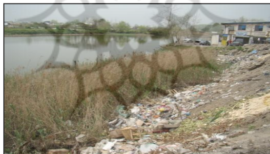
شکل ۳. عدم شیوه دفع مناسب زباله در محله عینک رشت

در خصوص میزان برخورداری از خدمات زیربنایی به شیوه برداشت پلاک به پلاک آمارها به شرح زیر می‌باشد. میزان برخورداری از آب لوله کشی شهری ۴۵/۷۲ درصد، برق ۸۵/۶۴ درصد، گاز ۸۰/۹۳ درصد و تلفن ۸۲/۳۵ درصد می‌باشد. در محله استخر عینک ۵۵/۷ درصد از جامعه آماری وضعیت فاضلاب را نامناسب می‌دانند. ۵۰/۵ درصد از خانوارها در مواقع بارندگی دچار آبگرفتگی در کوچه و خیابان می‌شوند. ۹۲/۲ درصد از خانوارهای محله استخر عینک در بررسی پیمایشی اظهار داشتند که جمع آوری زباله‌ها توسط شهرداری صورت می‌گیرد اما این کار چند روز یکبار انجام می‌گیرد.