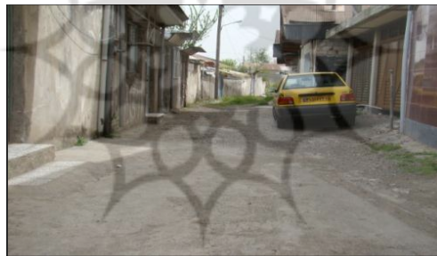
شکل ۲. نمایی از شبکه معابر در محله عینک رشت