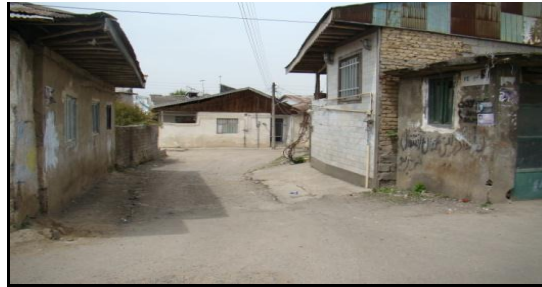
شکل ۴. شبکه معابر با سیستم روشنایی نامناسب در محله عینک رشت