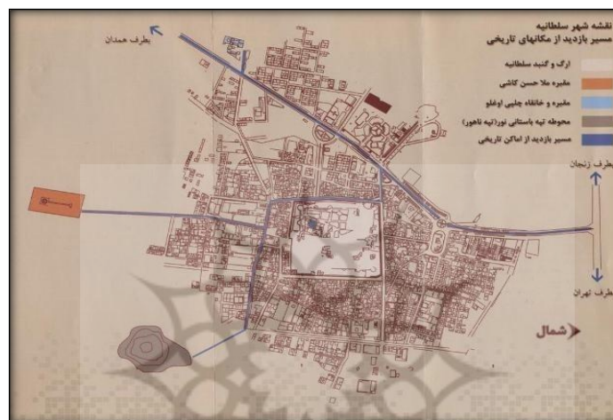
شکل ۲. شهر سلطانیه و محل گنبد سلطانیه