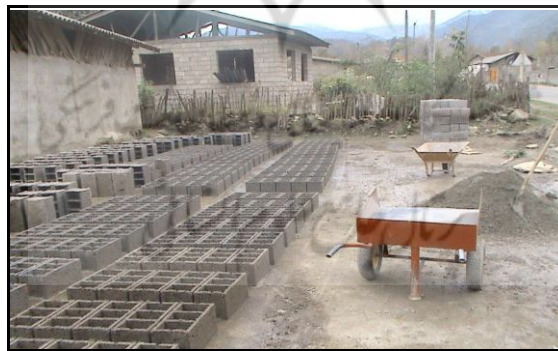
شکل ۵. مسکن جدید (بلوکه)، روستای لیره سر

مسکن جدید (بلوکه): این مسکن به تقلید و الگوبرداری از مسکن غیر بومیان در محدوده مورد مطالعه ساخته شده که از مصالح جدید و با فونداسیون پرهزینه و مقاوم می‌باشد. در واقع یکی از جنبه‌های تأثیرگذاری افراد غیر بومی، تحول در نوع و شکل ساخت مسکن است. از آنجایی که تعداد گردشگران بسیار زیاد می‌باشد و همه دارای مسکن شخصی نیستند، جهت اقامت خود مسکن روستایی را اجاره می‌کنند و این عامل انگیزه‌ای برای روستاییان جهت ساخت مسکن به سبک جدید با مصالح جدید، شکل‌تر و با وسایل رفاهی بیشتر و اجاره آن به گردشگران ایجاد نموده است. به علت تغییر کارکردها، شکل فرم مسکن نیز تغییر یافته است. به طوری که مسکن به صورت یک طبقه و یا اگر دو طبقه بنا شده باشد، طبقه همکف آن به جای اختصاص به دام به عنوان یک اتاق و فضای اضافی برای استراحت خانواده به خصوص در فصول گرم که ممکن است طبقه دوم را اجاره دهند و یا جهت انبار کردن محصولات و ابزار کشاورزی و وسایل اضافی منزل، به عنوان انباری استفاده شود. با توجه به جدول (۱)، تعداد این مسکن در روستاهای نمونه ۳۳ درصد از مسکن را به خود اختصاص داده‌است.