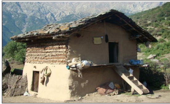
شکل ۲. کارکردهای مسکن سنتی - روستای بالابند