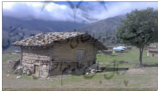
شکل ۳. مسکن دارورچین، روستای بالابند

مسکن دارورچین: این نوع مسکن در سازگاری کامل با اقلیم و نوع فعالیت اقتصادی حاکم بر محدوده مورد مطالعه است که در نواحی کوهپایه‌ای و کوهستانی و محدوده‌هایی که به جنگل نزدیک است، ساخته می‌شوند. کلمه دارورچین از سه لغت دار، به معنی درخت و وَر به معنی پهلوی و چین به معنی چیدن تشکیل شده است. ساخت دارورچین اغلب به صورت یک اتاقی با بام لته‌سر اجرا می‌شود. مسکن با دیوار دارورچین و بام لته‌سر محل سکونت کوه‌نشینان است. با توجه به جدول (۱)، روستاهای تالش سرا، نمکدره، نوشا، پیازکش و خانیان بیشترین درصد را در این نوع مسکن دارا می‌باشند و کمترین درصد در روستاهای جواهرده، کنسکوه، جنت رودبار، امامزاده قاسم، لتر و تودارک مشاهده می‌شود که نشان‌دهنده تحولات ناچیز در این روستاهاست. دلیل عمده آن ناشی از دور بودن از مسیر ارتباطی اصلی می‌باشد. در روستاهای نمونه ۲۹ درصد مسکن از نوع دارورچین می‌باشد. نمونه و نحوه ساخت این نوع مسکن را می‌توان در ترکیه به خصوص در منطقه بولو و حوالی آن که ساخت این نوع مسکن به جهت وجود جنگل‌های فراوان، متداول است، مشاهده نمود.