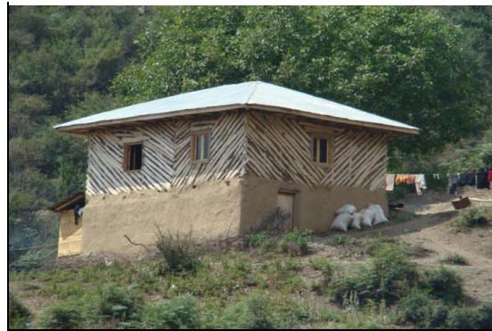
شکل ۴. مسکن زیگامه، روستای کوهسر

شکل کامل‌شده‌ای از مسکن دارورچین می‌باشد که پس از یکجانشین شدن به صورت دائم آن را تغییر داده‌اند. با توجه به جدول، روستاهای کوهسر، کنسکوه، لتر و پیازکش بیشترین تعداد را در این نوع مسکن دارا می‌باشند. مسکن زیگامه در روستاهای مورد مطالعه حدود ۳۵ درصد مسکن را شامل می‌شوند.