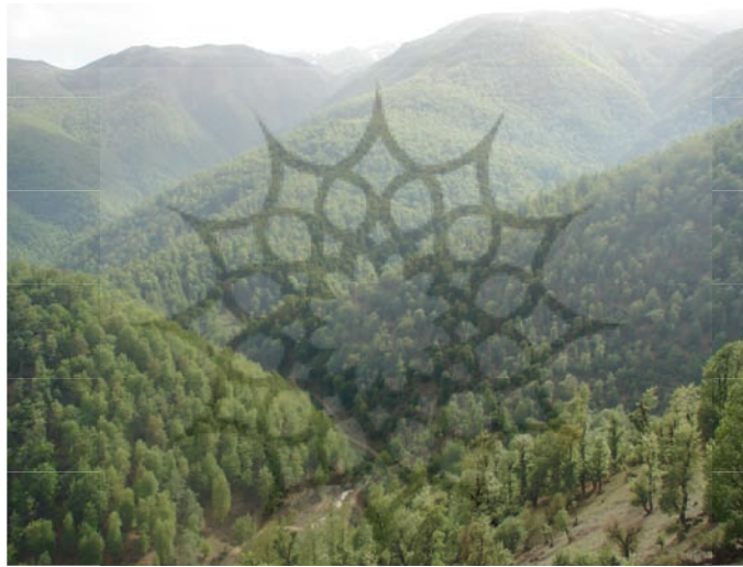
شکل شماره (۲) نواحی نسبتاً کم ارتفاع در بخش مرکزی حوضه

مرتعی مناسب بر خوردار است که در فصل بهار و تابستان، چراگاه مناسبی برای دامداران منطقه به حساب می‌آید. عکس شماره (۲) پتانسیل‌ها محیطی از قبیل شرایط مطلوب آب و هوایی، مراتع سرسبز، چشمه ساران، و چشم انداز منحصر به فرد زمینه پیدایش آبادی‌های فصلی و موقتی (برن، دشت دامن، زندانه، روشن ده ...) را به صورت پراکنده در سرتاسر این واحد ارتفاعی را فراهم آورده است در صورت گسترش این گونه آبادیها بدون هیچ گونه برنامه ریزی صحیح، در آینده نچندان دور چشم انداز منطقه تغییر خواهد کرد. همین امر باعث شده تا این واحد ارتفاعی نسبت به دیگر نقاط حوضه از آسیب پذیری بالایی برخوردار باشد. بنا بر این در ساخت وسازها و بهره‌برداری از زمین باید با دقت بیشتری عمل کرد. جدول شماره (۱)