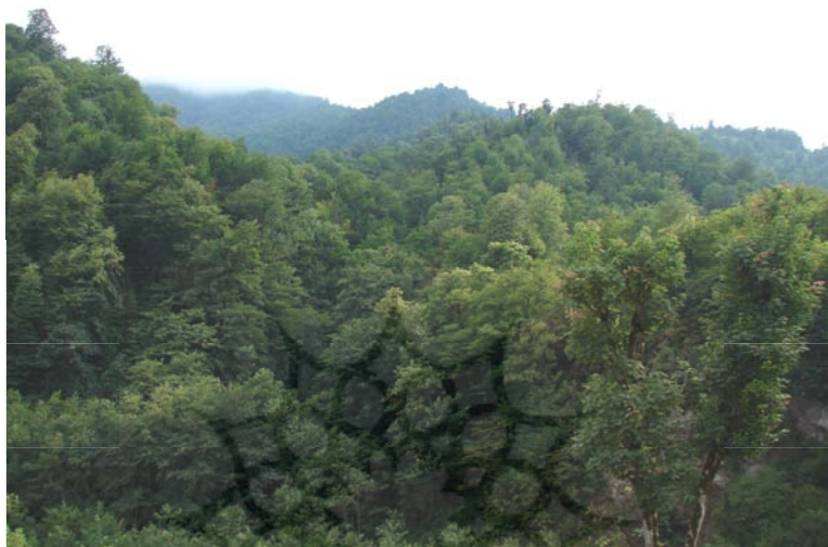
شکل شماره (۶) نمائی از پوشش جنگلی حوضه سفارود

دامنه‌های شرقی کوه‌های تالش به محدوده جنگلهای انبوه هیرکانین (خزری) تعلق دارند اما دامنه‌های غربی این منطقه در میان استپ زارها گسترش یافته‌اند. بالای ۷۰٪ از مساحت حوضه پوشیده از جنگل و مرتع بوده و مابقی زمینهای زراعی و آبادی می‌باشد. عکس شماره (۶)