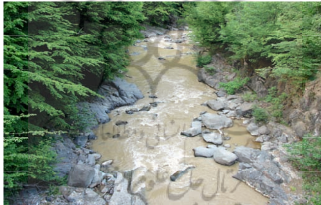
شکل شماره (۵)نمایی از رودخانه شفارود در بخش پایاب حوضه

سازنده های آهکی در سطح حوضه منجر به پیدایش چشمه‌ساران گوارا شده است. در مسیر رودخانه آنجائی که خطوط گسل قرار دارد آبشارهای نسبتاً مرتفعی یافت می‌شود. مهمترین منبع آبی حوضه، رودخانه شفارود با طول ۴۸ کیلومتر، به عنوان دومین رود پرآب ناحیه غرب گیلان می‌باشد (عکس شماره ۵). دو سرشاخه اصلی این رود از ارتفاعات ۲۷۰۰ متری واقع در ارده کوشن و پارگام بوده و در ارتفاع ۱۵۰۰ متری به هم می‌رسند. شاخه مهم دیگری از سوی جنوب رودخانه بنام خوشابر در ارتفاع ۳۵۰ متری به رود اصلی متصل می‌شود. میزان متوسط آبدهی سالانه ۱۸۶ میلیون مترمکعب می‌باشد. در سالهای خشک ۹۰ و در سالهای مرطوب ۳۰۷ میلیون مترمکعب حساب شده است. به دلیل پتانسیلهای بالای منابع آبی در حوضه شفارود نیروگاه برق آبی دهستان بیلاقی ارده و سد مخزنی در حال ساخت شفارود در بخش خروجی حوضه ضمن تامین نیاز برق و آب کشاورزی ساکنین اطراف حوضه می‌تواند زمینه استفاده گردشگران از دریاچه پشت سد در زمینه های قایقرانی، ماهیگیری، شنا و ... را فراهم سازد.