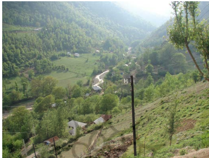
شکل شماره (۳) نواحی کم ارتفاع در بخش پایاب حوضه

تخریب و نابودی بخش‌های از آن را فراهم آورده است. (شرکت جنگل سفارود) که ادامه این روند فرسایش شدید خاک را به همراه خواهد داشت. شرایط خاص محیطی (ارتفاع کم، راه‌های ارتباطی، آب و هوای مطلوب، آب فراوان، ...) باعث شده تا اکثر آبادی‌های این واحد کوهستانی از قبیل ارده، وسکه، خجهدره، لثم، نوده بصورت دائمی بوده و بیشترین جمعیت منطقه را در خود جای داده است.