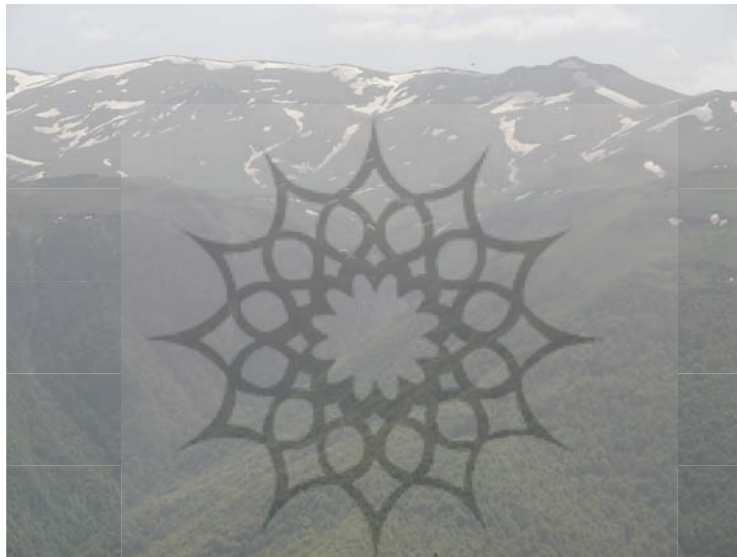
شکل شماره (۱) مرتفع ترین نقطه حوضه در بخش شمال غرب حوضه

این بخش از حوضه، ارتفاعات بالای ۲۵۰۰ متری واقع در غرب و خط الراس های آن را شامل می شود. عکس شماره (۱). که شامل قله شرف (۲۹۱۲ متر)، صادره سر، خیل گاه در بخش جنوب غرب حوضه می باشد. که حدوداً ۴٪ از وسعت حوضه را در بر گرفته است، این بخش از حوضه صخره ای می باشد و از نظر فرسایش - رسوب نسبت به نقاط دیگر حوضه که اکثراً پوشیده از جنگل و مرتع می باشد از آسیب پذیری کمتری برخوردار است، در صورت برنامه ریزیهای توسعه گردشگری در این بخش، باید بیشتر مورد ارزیابی و دقت قرار گیرد. مورفولوژی این واحد کوهستانی شامل صخره هایی با دیواره های تند و ستیخ های پرتگاهی می باشد که می تواند محل مناسبی برای صخره نوردی گردشگران ماجراجو باشد. جدول شماره (۱)،