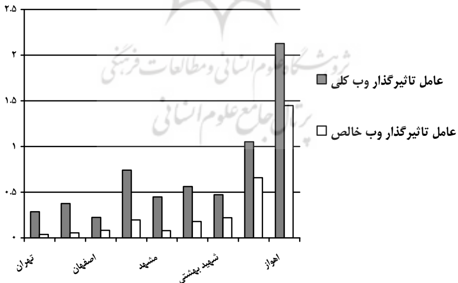
نمودار ۲: مقایسه عامل تأثیرگذار وب کلی و خالص دانشگاه‌های علوم پزشکی تیپ یک ایران