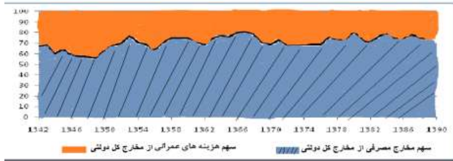
شکل ۱: درصد هزینه‌های مصرفی و عمرانی از هزینه‌های کل دولت