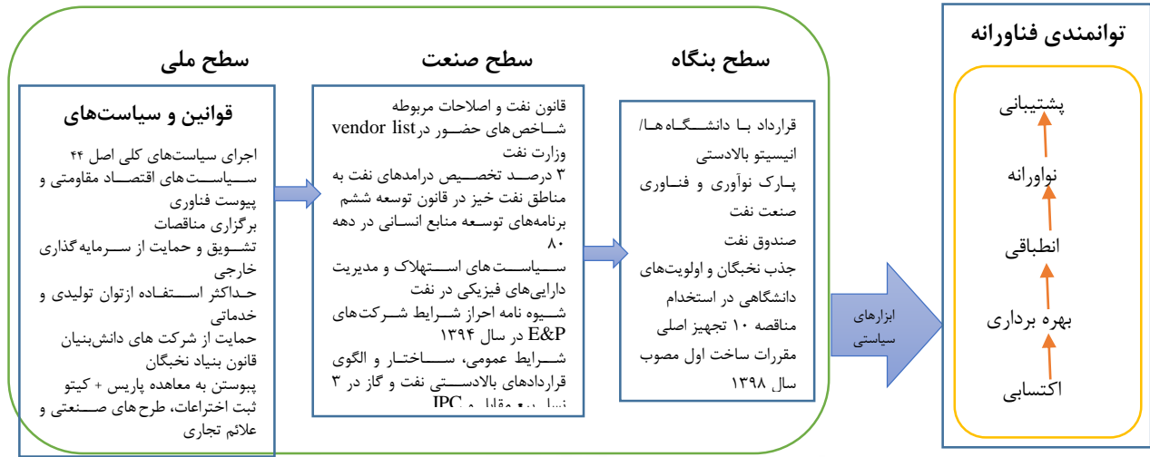
شکل ۱: مدل پژوهش

تنظیم‌گری در بهبود یادگیری و ارتقا توانمندی فناورانه در نظر گرفته شد. مصاحبه‌هایی با خبرگان بخش بالادستی نفت در خصوص سازوکار تاثیر سیاست‌های شناسایی شده در سه سطح