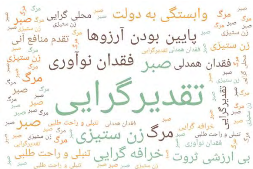
شکل ۱- مقوله‌های ضد توسعه

در ادامه در قالب یک تصویر مفاهیم مانع توسعه را به صورت اجمالی نشان خواهیم داد تا بتوانیم در یک شکل