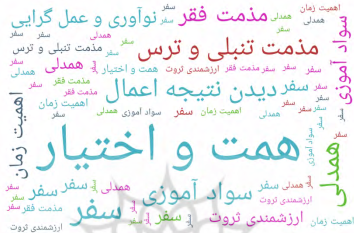
شکل ۲- مقوله‌های توسعه‌گرا

۱۰- همدلی: یکی از مهم‌ترین عناصری که باعث موفقیت گروه‌ها می‌شود، همدلی و همکاری است. خیلی از کارها به تنهایی ممکن نیست از جمله توسعه یافتگی جوامع. همکاری و همدلی اعضای یک جامعه در جهت منافع