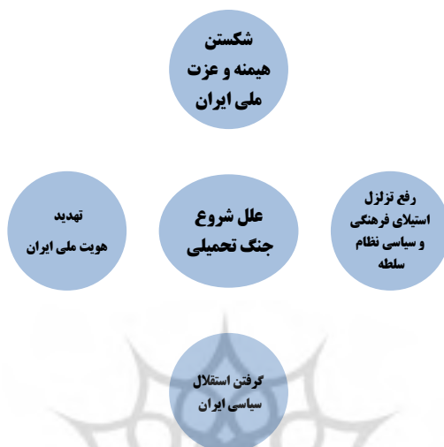
نمودار ۲- مدل مفهومی علل شروع جنگ تحمیلی

سؤال فرعی اول: علل شروع جنگ تحمیلی رژیم بعثی عراق علیه جمهوری اسلامی ایران، کدامند؟ در پاسخ به این سؤال نیز شش علت برای شروع جنگ تحمیلی دشمنان با عاملیت مستقیم رژیم بعثی عراق علیه جمهوری اسلامی ایران در بخش ادبیات نظری با الهام از روایات دفاع مقدس تبیین گردید که مدل مفهومی این بحث نیز در نمودار زیر نمایان می‌گردد: