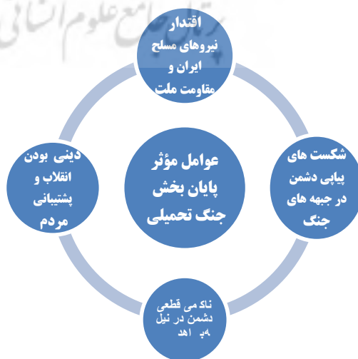
نمودار ۳- مدل مفهومی عوامل مؤثر در پایان یافتن جنگ تحمیلی

سؤال فرعی دوم: دلایل پایان یافتن جنگ تحمیلی کشور عراق علیه ایران، چه دلایلی بود؟ در پاسخ به دومین سؤال فرعی تحقیق، در بخش ادبیات نظری به حد کفاف مطالبی بیان شد و تبیین گردید که چهار عامل اصلی موجب شد که دشمن مهاجم که هر روز در یکی از جبهه‌های جنگ متحمل شکستی تازه می‌گردید، با توسل به هر وسیله و دستاویز ممکن، ملت‌مسانه پایان جنگ را به صورت صلح یا آتش بس خواستار شده بود و جمهوری اسلامی ایران نیز با توجه به محاسبات راهبردی ملی خود، قطعنامه ۵۹۸ سازمان ملل را برای قبول آتش بس پذیرفت؛ لذا در اینجا مدل مفهومی عوامل پایان جنگ در نمودار ذیل ارائه می‌گردد: