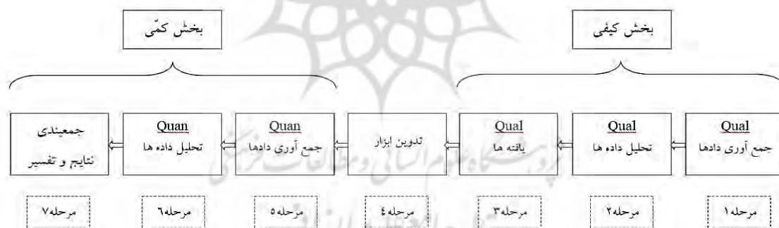
مدل ۱ - تدوین ابزار (با تاکید بر QUNA)

در پژوهش حاضر با توجه به هدف اصلی پژوهش که شناسایی گونه‌های هویت فرهنگی زنان شهر کاشان می‌باشد، روش تحقیق ترکیبی (آمیخته) بکار برده شده است. پژوهش ترکیبی یک طرح پژوهشی با مفروضات فلسفی و نیز روش‌های کاوشگری است. (کرسول و پلانورک، ۱۳۹۰) پژوهش‌های ترکیبی انواع مختلفی دارند که چهارنوع از متداول‌ترین آنها عبارتند از: طرح همسوسازی (مثلت سازی)، طرح تو در تو (لانه کردن)، طرح تبیینی و طرح اکتشافی. هدف از طرح دو مرحله‌ای اکتشافی آن است که نتایج روش اول (کیفی) باعث شکل‌گیری و روش شدن روش دوم (کمی) شود. (گرین و دیگران) و در این پژوهش از روش ترکیبی با رویکرد اکتشافی استفاده شده است. از آنجایی که در این پژوهش به دنبال شناسایی گونه‌های چند گانه از هویت فرهنگی و یافتن دلایلی برای ایجاد آنها در بین زنان هستیم از مدل تدوین ابزار استفاده می‌کنیم.