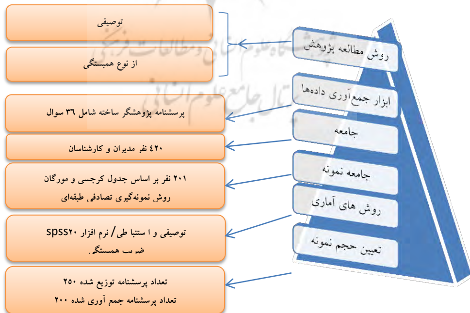
شکل شماره ۱: روش‌شناسی تحقیق (پژوهشگر ساخته)

جامعه آماری پژوهش حاضر شامل ۴۲۰ نفر می‌باشند. به منظور برآورد حجم نمونه بر اساس جدول کرجسی و مورگان ۲۰۱ نفر تعیین شده است که محقق برای اطمینان خاطر اقدام به توزیع ۲۵۰ پرسشنامه در جامعه نموده که داده‌های ۲۰۰ پرسشنامه