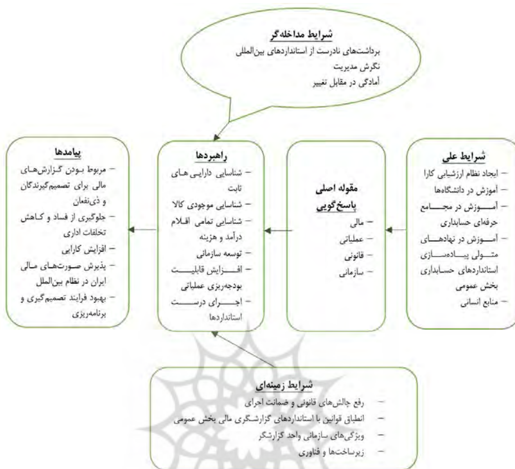
شکل ۱. الگوی طراحی شده سازوکارهای رفع موانع و محدودیت‌های اجرایی شدن استانداردهای حسابداری بخش عمومی

شرایط مداخله‌گر: شرایط خاص مرتبط با موضوع در دست بررسی است که بر بروز راهبردها اثر می‌گذارد (خاکی، ۱۳۹۶). در این پژوهش، سه مقوله «برداشت‌های نادرست از استانداردهای بین‌المللی، نگرش مدیریت، آمادگی در مقابل تغییر» به‌عنوان شرایط مداخله‌گر شناسایی شده‌اند.