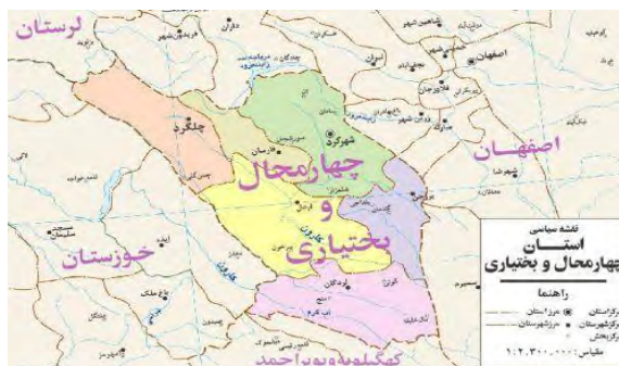
تصویر ۱: نقشه استان چهارمحال و بختیاری