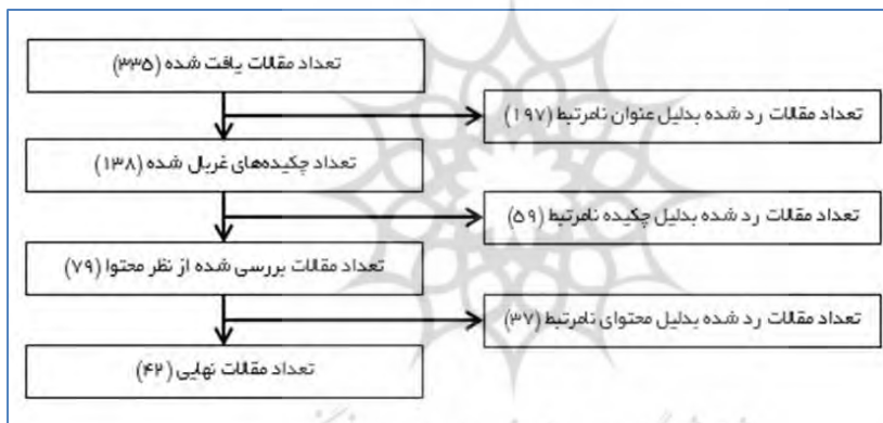
شکل ۲. شیوه انتخاب مقالات مناسب جهت تجزیه و تحلیل

گام سوم) ارزیابی کیفیت: برای انتخاب مقالات مناسب جهت تجزیه و تحلیل نهایی، براساس الگوریتم موجود در شکل ۲، مقالات طبق شاخص‌های مختلفی همچون؛ عنوان، چکیده و محتوای آن‌ها، مورد ارزیابی قرار گرفتند. در این گام، پژوهشگران، مقالات را چندین مرحله بررسی و بازبینی کرده و در هر مرحله، تعدادی از مقالات رد شدند. بطوریکه از بین ۳۳۵ مقاله یافت شده، پس از بررسی عنوان مقالات، تعداد آن‌ها به ۱۳۸ مقاله رسید و پس از بررسی چکیده مقالات، تعداد آن‌ها به ۷۹ مقاله کاهش یافت. در مرحله بعدی با بررسی محتوای مقالات باقیمانده و با توجه به نظر اساتید تیم پژوهشی، در نهایت تعداد ۴۲ مقاله، تایید و نهایی شدند.