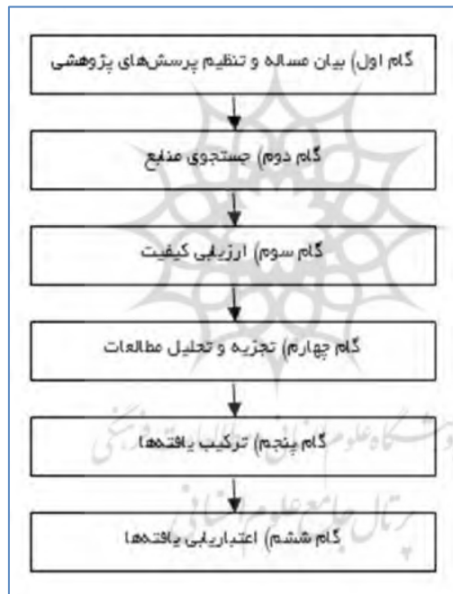
شکل ۱. گام‌های فراترکیب

(فینفگلد-کانِت ۱ ، ۲۰۱۴). این روش بر مبنای روش‌های گراندتئوری یا نظریه داده‌بنیاد بنا شده است با این تمایز که در این روش برای غلبه بر محدودیت عدم‌تعمیم‌پذیری نظریه داده‌بنیاد طراحی شده است تا یافته‌های کیفی پژوهش قابل‌تعمیم باشند. بر این اساس، این روش ضمن داشتن غنای مربوط به زمینه، از قابلیت انتقال و تعمیم یافته‌ها نیز برخوردار می‌باشد (فینفگلد-کانِت، ۲۰۱۸). این روش پژوهش، مبتنی بر شش گام سَندلوفسکی و باروسو ۲ (۲۰۰۷) (شکل ۱) و به‌صورت زیر می‌باشد: