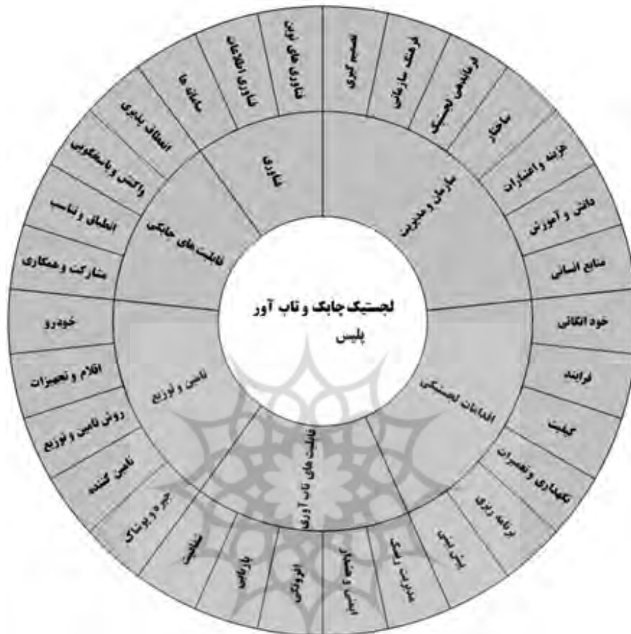
شکل ۲. مدل ترکیبی لجستیک چابک تاب آور پلیس