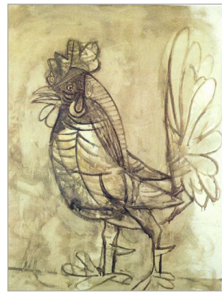
تصویر ۴. پابلو پیکاسو، خروس، ۱۹۳۸ (URL: 2)