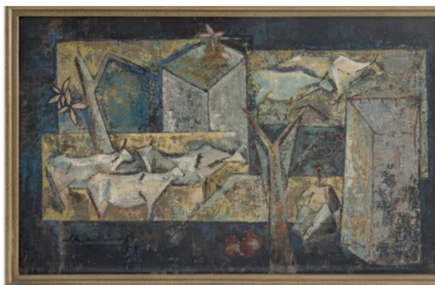
تصویر ۱. شاکر علی، روستا، ۱۹۶۲ (Wille, 2020: 200)