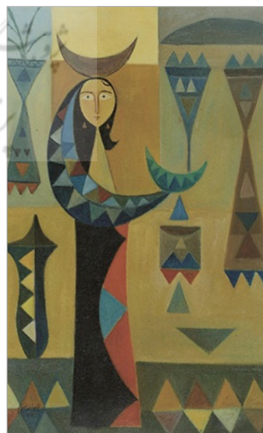
تصویر ۷. جواد سلیم، از مجموعه مردم بغداد، ۱۹۵۷