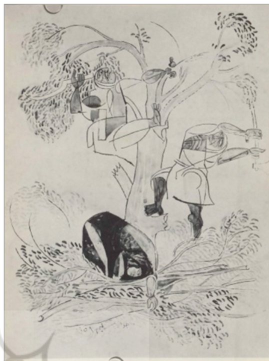
تصویر ۹. جواد سلیم، طرحی برگرفته از نگاره‌های مقامات حریری، ۱۹۵۳ (البکری، ۱۹۶۸: ۱۹)

جدول ۱. مطالعه تطبیقی نقش، جایگاه و آثار جلیل ضیاءپور، جواد سلیم و شاکر علی