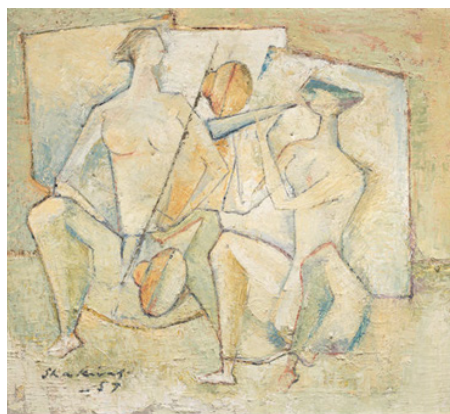
تصویر ۲. شاکر علی، نوازنده، ۱۹۶۷ (URL: 1)