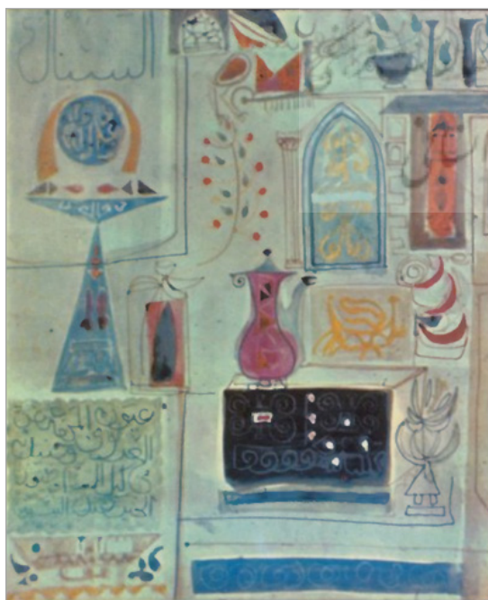
تصویر ۸. جواد سلیم، بغدادیات، ۱۹۵۷ (البکری، ۱۹۶۸: ۱۹)

کرد. «سلیم در نقاشی‌هایش می‌کوشید متأثر از کوبیسم و به‌ویژه پیکاسو را با سنت‌های هنری گذشته (بین‌النهرین و اسلامی) تلفیق کند» (پاکباز، ۱۳۹۴: ۸۴۱). «او موضوعات بومی همچون زنان و مردان عرب را به اشکال هندسی تجزیه می‌کرد و با مینیمال کردن عناصر تصویر، به سمت آستره حرکت می‌کرد. این فرمالیسم امکان می‌داد که ترکیب‌بندی مدرن از سوزه‌های بومی، تاریخی، فولکلور ارائه دهد» (Ali, 2001: 25). این رویکرد شبه‌کوبیستی در آثار دیگر هنرمندان عراق چون فائق حسن و حافظ الدروبی نیز تجربه شد. حافظ الدروبی، از شاخص‌ترین هنرمندان عراق در سبک کوبیسم است که نوعی مردم‌نگاری مردم کوچه و بازار در سبک مدرن دارد. فائق حسن، از دیگر هنرمندان پیشتاز در مکتب ملی عراق بود که او طیف وسیعی از سبک‌های هنری را دنبال کرد؛ از امپرسیونیسم تا کوبیسم و در همه آنها بر مضامین بومی و ملی تأکید داشت. با این حال، جواد سلیم جایگاه برجسته‌تر در هنر مدرن عراق یافت. او از مؤسسان گروه هنر نو بغداد (۱۹۵۱) بود که نقش مهمی در شکل دادن به هنر مکتب ملی عراق داشت. همچنین، نقش محوری در دانشکده هنرهای زیبای بغداد داشت و بر نسل‌های بعد هنرمندان عراق و عرب تأثیر گذاشت. در واقع او بود که «با ارجاع به سبک‌های سومری، بابلی و هویت بین‌النهرین، سبک هنر عراقی را قابل شناسایی کرد» (Ali, 1997: 145).