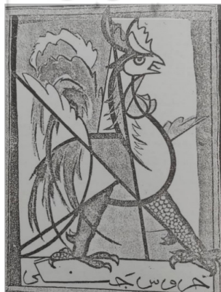
تصویر ۵. جلیل ضیاءپور، نشان انجمن خروس جنگی، ۱۳۲۷ (دلزنده، ۱۳۹۵: ۲۶۱)