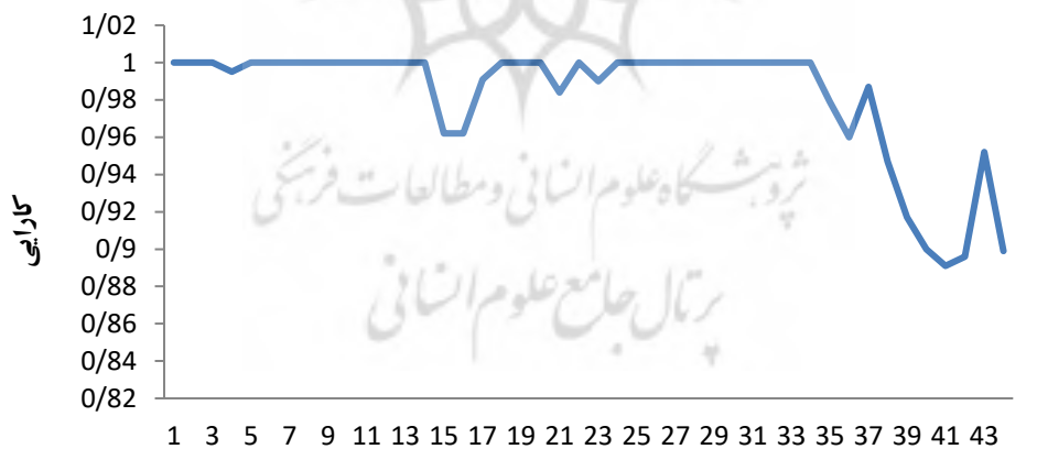
نمودار ۲. تغییرات سالانه کارایی بخش عمومی ایران

تغییرات کارایی بخش عمومی هم به صورت جداول عددی و هم به صورت نموداری به تصویر کشیده شده‌اند اما علی‌رغم اینکه این اعداد و ارقام روند تغییرات را به صورت شهودی به ما نشان می‌دهند ما به یک ابزار احتیاج داریم تا بتوانیم تغییرات کارایی را در مقاطع مختلف به لحاظ نظری مقایسه کنیم و با قطعیت به این سؤال پاسخ دهیم که کارایی بخش عمومی افزایش یا کاهش یافته و یا در حالت سوم تغییر معنی‌داری نداشته است. ابزاری که در این پژوهش برای انجام این مقایسه مورد استفاده قرار گرفته است آزمون مجموع رتبه‌های من-ویتنی ۱ (آزمون U) می‌باشد. برای بررسی معنی‌داری ناکارایی در قیاس با مرز کارا در کل سنوات حاکمیت ابتدا از آزمون U استفاده شده تا به طور کلی معنی‌داری ناکارایی ملاحظه گردد. سپس یک بار کل سنوات را به دو قسمت مساوی ۲۲ ساله تقسیم نموده و به عنوان دو مجموعه جهت مقایسه کارایی از آزمون U استفاده شده تا کارایی نیمه اول دوره تحت بررسی با نیمه دوم آن از منظر تغییرات کارایی مقایسه شود.