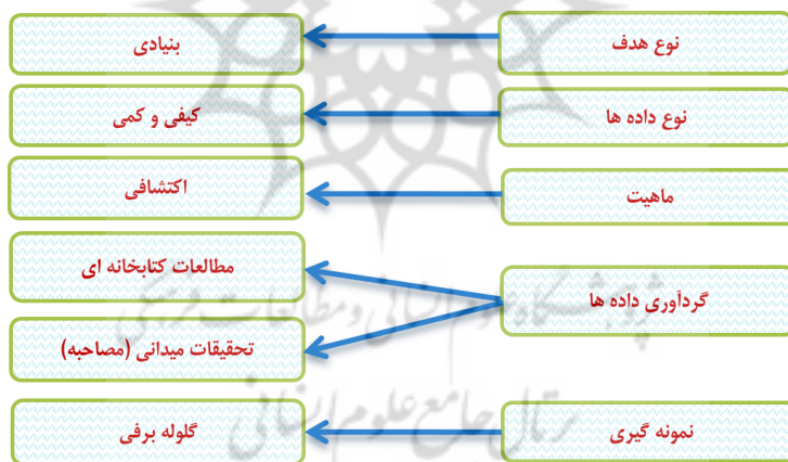
۲- مدل روش شناسی پژوهش

از این رو، تحقیق حاضر از لحاظ هدف، بنیادی است و در دسته مطالعات میدانی قرار می گیرد. شیوه گردآوری داده ها نیز با استفاده از مصاحبه و مطالعات کتابخانه ای بوده به گونه ای که داده های کیفی مورد جمع آوری قرار گرفتند. همچنین تحقیق حاضر از لحاظ نوع روش، در دسته مطالعات توصیفی - اکتشافی قرار می گیرد. از سویی شیوه اجرای پژوهش حاضر به صورت آمیخته می باشد. برای گردآوری اطلاعات لازم نیز روش مصاحبه مورد استفاده قرار گرفته است؛ برای تحلیل داده های حاصل از مصاحبه های انجام گرفته نیز از تکنیک تجزیه و تحلیل تم استفاده شده است. با توجه به ویژگی آزمایشی و یا غیرآزمایشی بودن تحقیقات، روش تحقیق حاضر، روش غیرآزمایشی و پیمایشی محسوب می شود. در تقسیم بندی دیگر، روش تحقیق را کتابخانه ای و میدانی در نظر گرفته اند که در تحقیق حاضر از هر دو این روش ها استفاده شد. (آذر و مومنی، ۱۳۹۰)