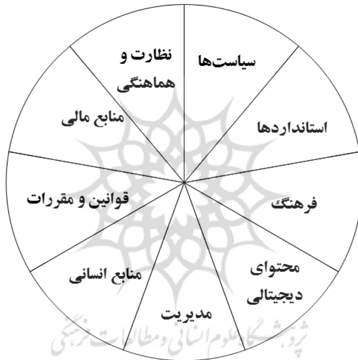
شکل ۲. ابعاد آمادگی فناوری نرم در یادگیری الکترونیکی (داراب و منتظر ۲ ، ۲۰۱۱)

آمادگی نرم بیان‌کننده همه عوامل و فناوری‌های نرم است که در توسعه نظام‌های یادگیری الکترونیکی و ایجاد و پشتیبانی محیط‌های آموزشی برخط ۱ مورد نیاز است. با توجه به بررسی مدل‌های تدوین شده در حوزه ارزیابی آمادگی یادگیری الکترونیکی (موسا و همکاران، ۲۰۱۶). اجزای این بخش در شکل ۲ مشاهده می‌شود.