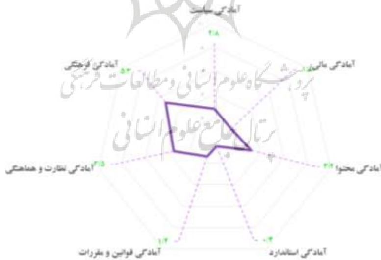
شکل ۴. نمودار راداری آمادگی ابعاد فناوری نرم در دانشگاه‌های منتخب کشور برای تحقق یادگیری الکترونیکی

همچنین میانگین امتیاز کسب‌شده برای هر یک از ابعاد آمادگی نرم دانشگاه‌ها نیز به‌صورت نمودار راداری در شکل ۴ قابل مشاهده است. این نتایج حاکی از آن است که میانگین امتیاز دانشگاه‌ها ۲/۶ از ۱۰ و نشان‌دهنده سطح «ضعیف» آمادگی ابعاد فناوری نرم دانشگاه‌ها در زمینه یادگیری الکترونیکی است.