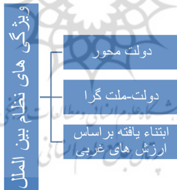
شکل شماره ۲

که از سوی این جریان‌ها مورد تهاجم واقع شده است. فراروایتی که به باور آنان سیمای ظاهری نظم مدرن را نمایان می‌کند. به باور عبدالسلام فرج، کوشش برای برهم زدن این مرزها و برپایی خلافت بر هر مسلمان واجب است (۱۹۸۱: ۳-۴). او در الفریضة الغائبة ایده حکومت همه‌شمول اسلامی را طرح کرده و تصویری کلی از آن را ترسیم کرده است. گستره حکومت اسلامی مد نظر او، در گام نخست برهم زنده مرزهای رسمی و شناخته شده کنونی است. در واقع، بازگشت به خلافت یا آنچه که فرج با نام حکومت اسلامی به توضیح آن پرداخته، در گام نخست نیازمند گذر از مرزهای دنیای مدرن است. وجوب برپایی خلافت یا حکومت اسلامی نیازمند برهم زدن نظم موجود و عبور از نظم مدرن است (همان، همان‌جا). نظم بین‌الملل مدرن به مثابه فراگیرترین دستاورد غرب مدرن، در شمار مهم‌ترین موضوع‌های مطرح در اندیشه تکفیریان جهادی است. بی‌گمان شناسایی و فهم منطق عمل آنان بدون مراجعه به درک و برداشته‌شان از این نظم مستقر مقدور نخواهد بود. مؤلفه‌های اصلی برداشت آنان از نظم بین‌الملل را در شکل زیر ببینید: