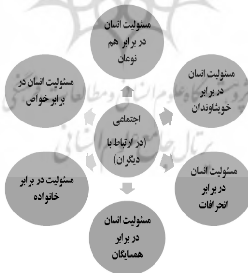
نمودار ۲-۴- اصول مولفه مسئولیت‌پذیری اجتماعی در اسلام

در مقاله حاضر تنها به توضیح چارچوب مفهومی بعد اجتماعی مسئولیت‌پذیری در سبک زندگی اسلامی پرداخته می‌شود که آن نیز اصولی را در بر می‌گیرد که در جدول (۲-۴) به آن‌ها اشاره شده است: