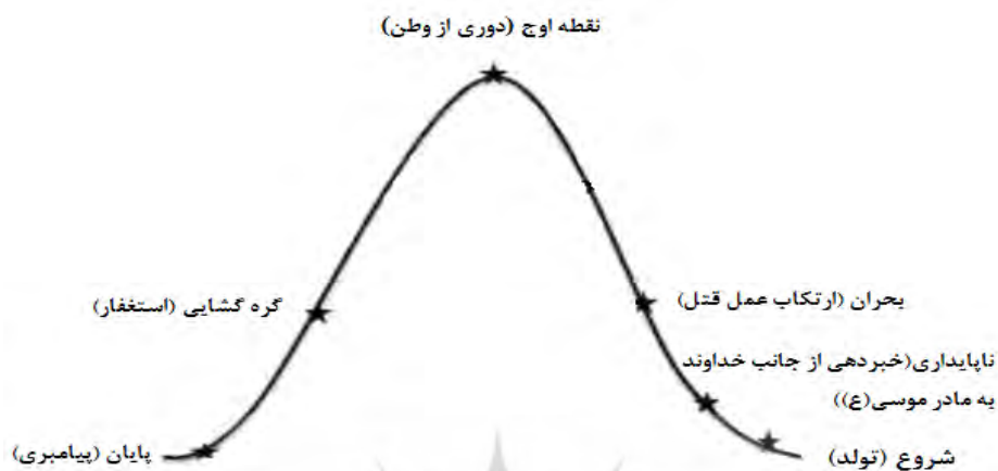
نمودار ساختاری داستان حضرت موسی (ع)

پژوهشگاه علوم انسانی و مطالعات فرهنگی پرتال جامع علوم انسانی