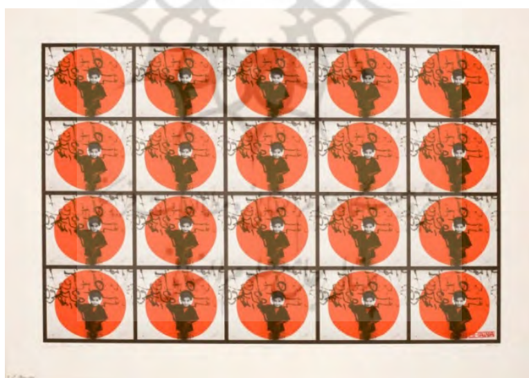
تصویر ۳. لیلا شوا، بیست هدف، ۱۹۹۴