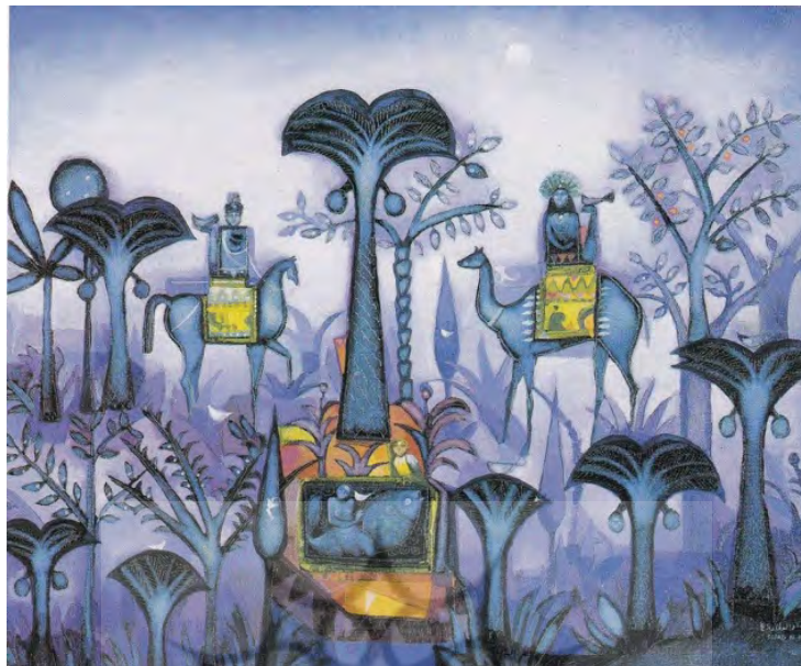
تصویر ۲. سعاد العطار، بهشت آبی، ۱۹۸۹