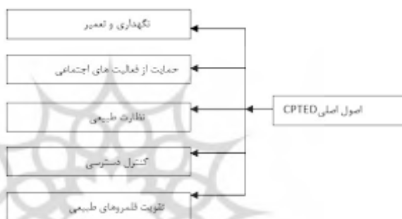
نمودار ۱. مؤلفه‌های مدل پیشگیری از جرم [۱۴]

امکانات و تسهیلات به وجود می‌آورند. در فضاهای مختص بانوان زنان قادر به سهیم بودن تجارب خود باهم هستند و همچنین بر احساس انزوای خود در جامعه غلبه می‌کنند. محیط فیزیکی می‌تواند تأثیرات مستقیمی بر بستر جرم به‌وسیله طرح قلمروها، کاهش یا افزایش دسترسی‌ها، به وسیله تقویت مرزها داشته باشد. یک محیط دارای عرض کمتر نسبت به جرم آسیب‌پذیرتر است، زیرا فعالیت‌ها را محدود می‌کند و برای افراد ارتکاب جرم را آسان‌تر می‌کند. جفری براساس نتایج و محققان قبلی نظریه CPTED را در کتابش در سال ۱۹۷۱ به نام جلوگیری از جرم با استفاده از طراحی محیط ارائه داد [۱۴، ص ۲۱۰-۲۳۰]. جفری در نظریه‌اش بر نقش محیط فیزیکی در ایجاد تجربیات هنجار و ناهنجار مختلفی که ظرفیت تغییر رفتار را دارد تأکید می‌کند.