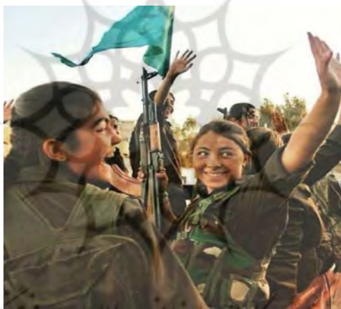
تصویر ۲. گریلاهای زن مدافع خلق در کوبانی

در اینجا با تغییری دیگر مواجهیم. آنچه زنان کرد از جنگ، به‌ویژه جنگ با داعش، درک می‌کنند بیشتر فرمی از مقاومت است تا جنگ. مقاومت فرمی از مبارزه برای زندگی است، اما جنگ ممکن است برای حمله به دیگری صورت بگیرد. این مسئله را می‌توان در نام یکی از صفحه‌های عمومی در فیس‌بوک در زمینه مبارزه زنان کوبانی مشاهده کرد: «مقاومت، زندگی است.» زنان کرد تجربه مقاومت زنانه در کوبانی را به‌منزله تجربه‌ای درک می‌کنند که در آن کنش زنانه به اوج خود می‌رسد. زنان عاملیت خودشان را نشان می‌دهند و مرکزیت مردانه در جنگ و مقاومت را به چالش می‌کشند. یکی از زنان کرد در صفحه فیس‌بوک خویش چنین نوشته است: