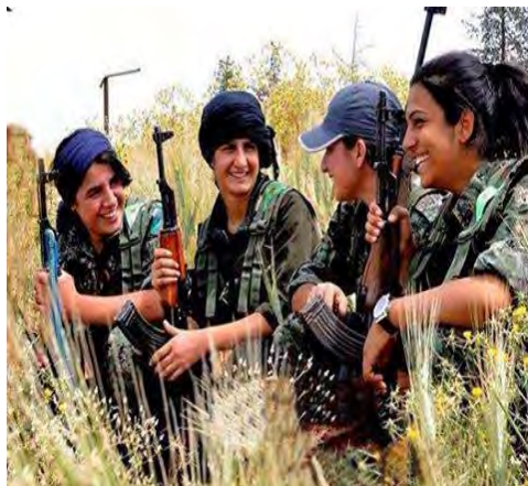
تصویر ۱. گریلاهای زن مدافع خلق در کوبانی