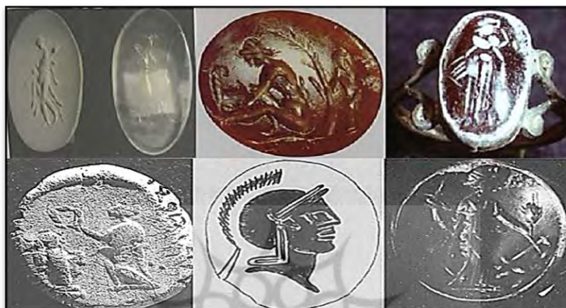
شکل ۴. مهرهای سلوکی و اشکانی با نقش زن [نگارندگان]

علاوه بر نقش مایه الهه‌های یونانی بر مهرها و اثرمهرها می‌توان از نقوش بانوی در حال اهدای گل به صورت زانوزده، زنی در حالت ایستاده در حال اهدای شاخه گل، زن نشسته و در حال دوشیدن حیوان، و زنی ایستاده و در حال راه رفتن اشاره کرد.