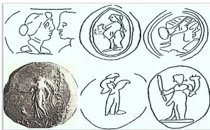
شکل ۶. اثرمهرهای سلوکی شهر اروک با نقوش گوناگون زنان [۱۸]

وفور نقش خدایان و الهه‌های یونانی نیز خود مبحث جداگانه‌ای دارد، زیرا علاوه بر الهه‌های مونث چون تیکه، نیکه، آتنا، و آفرودیت، خدایان مذکری چون آپولو، زئوس، و هرمس نیز در کنار الهه‌ها به چشم می‌خورند، اما تعداد آن‌ها بسیار اندک است. این گرایش معنادار به سمت عریان بودن الهه‌ها در کدش مبحث توجه به اندام جنسی زنان و تأکید بر آن‌ها را پیش می‌کشد. شارون هربرت، کاوشگر کدش، اعتقاد به دوجنسی بودن این تصاویر و مسئله‌اندرولولوژی دارد [۱۴، ص ۲۲]. اما در محوطه سلوکیه دجله، آتنا و تیکه با ظاهری موقر و لباسی پوشیده تا زانو به همراه کلاه و تاج به چشم می‌خورند. این امر شاید مبین تفاوت نگاه مردمان دو جامعه کدش و سلوکیه نسبت به یکدیگر باشد. اما موضوع پیچیده‌تر این است که هر دو مجموعه بایگانی‌های اثرمهر از نوع اداری و دولتی دارند. از این منظر، شاید بتوان نظریه استقلال اداری و اقتصادی شهرهای سلوکی را مطرح کرد. البته شواهدی از مبارزه و قیام مردم کدش و سلوکیه با حکومت مرکزی در دست است [۱۵، ص ۶۶]. ذکر این نکته نیز ضروری است که روی همه اثرمهرهای سلوکی نیز زنان بدون پوشش و حجاب دیده می‌شوند.