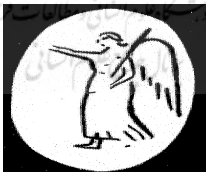
شکل ۳. الهه نیکه بر مهر اشکانی شهر نسا [۲۰]

نیکه تجسم پیروزی بوده و او را معمولاً با بال و درحالی که با سرعت زیادی در حال پرواز است تصویر می‌کردند [۳، ص ۶۲۲]. تصویر نیکه، علاوه بر مهرها و اثرمهرها، بر سکه‌های دوران سلوکی و اشکانی نیز به چشم می‌خورد. برای نمونه، می‌توان از سکه‌های آندراگوراس، ساتراپ پارسی ایالت پارت، یاد کرد که نیکه را سوار بر ارابه نشان می‌دهد. همچنین، بر پشت سکه‌های اکثر شاهان سلوکی تصاویر ایستاده الهه نیکه، که شباهت زیادی به اثرمهرهای سلوکیه دارند، به چشم می‌خورد [۱۶، ص ۲۰]. اثرمهری از الهه نیکه نیز از اروک به دست آمده که شباهت بسیاری زیادی به نمونه‌های سلوکیه دارد [۱۶، ص ۲۱]. از محوطه نسا نیز از الهه نیکه اثرمهری به دست آمده که متعلق به دوره اشکانی بوده و حاکی از نفوذ فرهنگ یونانی و هلنی در این شهر است [۴، ص ۲۰].