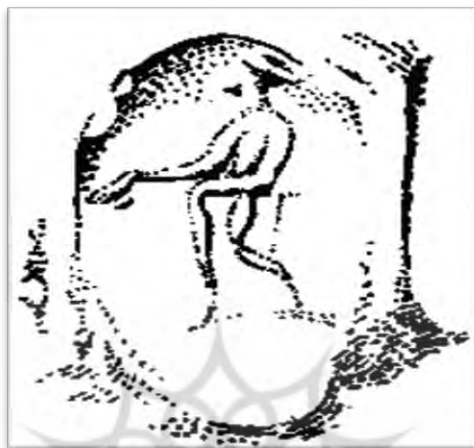
شکل ۵. اثرمهر اشکانی از شهر اشکانی نیپور [۱۳]

موتیف‌های هلنی این مجموعه قابل مقایسه با اثرمهرهای اروک و سلوکیه و حتی کدش‌اند. اما از حضور زنان روی آن‌ها اثری دیده نمی‌شود که این امر با توجه به اثرمهرهای دیگر محوطه‌های اشکانی چندان عجیب به نظر نمی‌رسد.