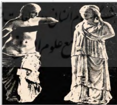
شکل ۷. تندیس‌های زنان از محوطه نسا [۴]