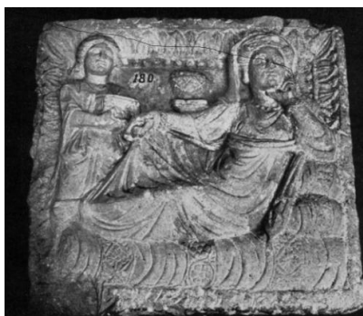
تصویر ۶. زنان اشراف پالمیری [۳۷، ص ۱۶۴]

می‌شود، دو کاهن در دو طرف خانواده‌شاهی در حال ریختن مواد در داخل بخوردان‌اند. شاه بر روی تختی مزین نشسته و در سمت راست وی یک کودک و ملکه قرار دارند.