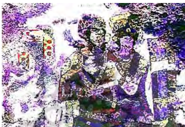
تصویر ۷. نقش شاه و شاهبانو در نقاشی‌های کوه خواجه [ص ۲۴، ۴۲]

چنگ دیده می‌شود [ص ۱۳، ۱۲۴-۱۲۵]. همچنین، در اولبیا، در جنوب روسیه، بر روی صفحه‌های استخوانی مجالس جشن و مهمانی همراه با موسیقی و رقص و بندبازی دیده می‌شود که زنی برهنه در حال رقص است [ص ۲۴، ۲۶۸]. با توجه به آنچه گفته شد، زنان به آلات موسیقی اعم از چنگ، تنبور، فلوت، طبل، شیپور، تار، قاشقک، دف، و عود آشنایی داشتند و حتی در مراسم مذهبی نیز حضور می‌یافتند و به اجرای برنامه می‌پرداختند. آنان حتی در مقام خواننده و رقص نیز ظاهر شده‌اند.