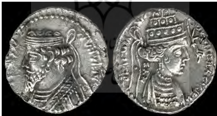
تصویر ۱. سکه موزا و فرهاد [۴۲]

موزا در سال ۲ ق.م فرهاد چهارم را به زهر مسموم [۹، ص ۱۲۵] و چهار سال بعد با پسرش، که اینک به فرهاد پنجم معروف شده بود، ازدواج کرد [۳۰، ص ۵۴]. به مناسبت این ازدواج سکههایی با تصویر موزا و فرهاد پنجم ضرب شد و این برای اولین بار است که در تاریخ ایران باستان نقش ملکه بر روی سکه ضرب می شود (تصویر ۱).