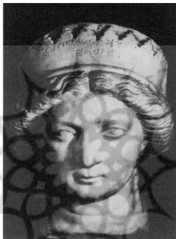
تصویر ۲. مجسمه مرمین موزا [۲۴، ۹۶]

نوشته پشت سکه‌ها موزا را چنین معرفی کرده است: «سکه ایزدبانو اورانیاموزا، ملکه» [۱۸، ص ۳۹۵]. بر روی این سکه‌ها لقب شهبانوی بانوان نیز دیده می‌شود [۲، ص ۱۰۸]. بر پشت چهاردرهمی‌ها فرشته‌ای (نیکه) حلقه شهریاری را به سوی تاج ملکه موزا می‌برد. بنابراین، می‌توان چنین استنتاج کرد که موزا از چنان موقعیتی برخوردار است که هم لقب ایزدبانو را دریافت کرده و هم نیکه حلقه شهریاری را، که قبلاً فقط مختص شاه شاهان بوده، به وی تفویض داشته و در واقع در امر سلطنت با فرهاد پنجم شریک است. علاوه بر سکه‌های موجود، در شوش سردیسی مرمین (تصویر ۲) به دست آمده که کالج [۳۴]، کومونت [۳۵]، گیرشمن [۲۴، ص ۹۶] و کاوامی [۳۶] آن را به موزا منتسب کرده‌اند.