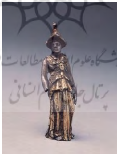
تصویر ۸. مجسمه زن از هترا [۱۷]