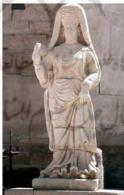
تصویر ۱۰. زن چنگ‌نواز از شوش [۲۵، ص ۶۶]