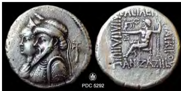
تصویر ۳. سکه ملکه آنزازه و کمسکیردوم [۴۲]

سنت ازدواج در بین شاهان اشکانی ابتدا به صورت تک‌همسری بوده، زیرا آنان در ابتدا زندگی صحراگردی داشته و پس از به قدرت رسیدن یکجانشین شدند و از رسوم پیشین فاصله گرفتند. پیوند تنگاتنگ این پادشاهی با سنن شرقی سبب رواج و گسترش چندزنی شد که پیش‌تر در خاندان هخامنشی میان خاندان سلطنتی و نجبا متداول بود [۲۷، ص ۹۱]. هرودیان اعتقاد دارد که شاهان اشکانی چندین همسر برمی‌گزیدند، اما به نظر می‌رسد پسری که مادرش از تبار خاندان اشکانی بود برای جانشینی بر دیگران ارجحیت داشته و این دلیلی است بر ازدواج‌های درون‌خاندانی [۴]. سنت چندهمسری براساس مدارک باستان‌شناختی همچون اسناد بابلی و چرم‌نوشته‌های اورامان نیز تأیید شده است. در سطور یک تا شش چرم‌نوشته شماره ۱ اورامان نام زنان مهرداد دوم به نام‌های سیاکه، آزاته، و اریازاته اوتومه ذکر شده است. همچنین، در سطور یک تا سه چرم‌نوشته شماره ۲ اورامان مربوط به سال ۲۹۱ سلوکی (۲۲۱ م) نام آلنیره، کلئوپاترا، باسیرتا، و بیستیاناپس آمده است. این سند با تطابق تاریخ مندرج در آن مربوط به دوره فرهاد چهارم است [۳۱، ص ۲۴۴]. به‌علاوه شاهان زنانی موقت بسیاری داشتند [۳، ص ۲۱۹]. اهمیتی که اشکانیان برای حرم خود قائل بودند نه از شیوه رفتار خاص شرقی سرچشمه می‌گرفت و نه از فساد دستگاه درباری و شاهی؛ بلکه ضرورتی سیاسی بوده است، زیرا هر بانویی در حرم یا شاهزاده‌ای بود یا دختر یکی از امیران فرودست یا از اشراف یا دست‌کم هدیه یکی از پادشاهان. بدین‌گونه هر یک از بانوان حرم نماینده یک پیوند سلطنتی یا همبستگی دوستانه به شمار می‌رفت و مجموعه‌ای از پیوندهای سیاسی قدرت‌های داخلی و خارجی با دربار را تشکیل می‌دادند [۲۲، ص ۵۴].