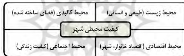
شکل ۱: دیاگرام عمومی کیفیت محیط شهری (Gabriel, 2009)

صرفه‌های بیرونی به وجود آمده و شاهد غلبه‌ی تدریجی مراکز فعالیت و کاربری‌های ناسازگار بر بافت‌های سکونت، کمبود نسبی خدمات محله‌ای و همچنین فشردگی کالبدی در منطقه شده، که همین امر تا اندازه زیادی سبب نادیده گرفتن محیط‌های سکونت و کیفیت محیط شهری در این منطقه از شهر اردبیل شده است. همچنین با فرض اینکه هیچ‌گونه مطالعه و ارزیابی در زمینه‌ی کیفیت محیط شهری در شهر اردبیل انجام نگرفته است، به نظر می‌رسد انجام یک ارزیابی اصولی از کیفیت محیط شهری ضروری باشد. با توجه به این مسائل پژوهش حاضر با هدف سنجش کیفیت محیط شهری در منطقه چهار اردبیل بر آن است که با توصیف و تبیین مفهوم کیفیت، ضمن شناسایی مؤلفه‌های مؤثر بر بهبود کیفیت محیط شهری در منطقه مزبور، شاخص‌های تأثیرگذار و چگونگی ارتباط این شاخص‌ها را در محیط شهری منطقه مورد مطالعه بررسی نماید.