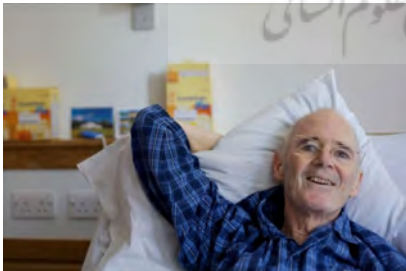
تصویر ۴، (URL3) / متن تصویر: بیهودگی ساعات بی‌پایان در بیمارستان، روح او را فرسوده کرد. اما، ما فقط متوجه آن شدیم، زیرا او را می‌شناختیم. در ظاهر، او همچنان به درخشیدن، بخشیدن و زندگی کردن ادامه می‌داد، زیرا او برای یاری رساندن زندگی کرد. و تا جایی که ممکن بود زندگی کرد.

در سیر روایی پروژه پدر، تصویر ۳ پس از تصویر پیشین آمده است. پرتره‌ای که قرار است خانواده باشد، اما فقط سایه دختر، پدر پشت به تصویر و فردی که صورت مبهم دارد و برای ما شناخته شده نیست. عکس افقی است و تلاش شده بازتاب تصویر عکاس در تصویر باشد. براینی در این تصویر هم دختر است و هم عکاس. به لحاظ تکنیکی، این عکس بهتر از عکس‌های پیشین است. در میان شلوغی تصویر، در سایه عکاس، یخچالی وجود دارد که درب آن پر از عناصری است که شاید خاطره‌ها هستند. در عکس با سه زمینه و لایه در تصویر روبه‌رو هستیم. طبیعت پس‌زمینه عکاس، تصویر عکاس و تصویری که انسان‌ها و اشیاء پشت شیشه وجود دارد. این لایه‌های، لایه‌های زندگی پدر نیز هست. زندگی‌ای که پشت شیشه رفته، سایه‌هایی که از زندگی مانده و یک فضای مبهم که آینده‌ای نامعلوم دارد. این خانواده نمی‌توانند در یک پیک نیک چنین عکس یادگاری بگیرند. این تنها فرصت برای پرتره است؛ از پشت شیشه با سایه.