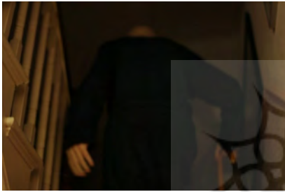
تصویر ۵، (URL3) / متن تصویر: من پایان را عکاسی کردم؛ پیش از آن که آن را ببینم.

تصویر در مجموعه است که پدر را به طور واضح از روبه‌رو نشان می‌دهد. عکس افقی است و به لحاظ قاب‌بندی بسیار خوب است. قرار گرفتن پدر در پایین و راست تصویر، فضای بسیار خوبی تداعی کرده است. گوشه‌های عکس کمی سایه دارد و تمرکز بر سوژه اصلی است. ترکیبی از رنگ‌های گرم و سرد در عکس، نوعی کنتراست درست کرده است. پدر در حال خندیدن است و البته این خنده تلخ است. این خنده به خاطر عکاس/دختر است یا اینکه پدر به خودش امید می‌دهد. پدر طوری نشان می‌دهد که هنوز به پایان نزدیک نیست، اما شاید به این تصور اشتباه می‌خندد و آن را به هجو می‌کشد.