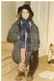
تصویر ۱۰، (URL3) / متن تصویر: من به عنوان پدر، ۱۹۸۶.

است. عکس فروپاشی ذهنی را نشان می‌دهد که در کنار فروپاشی بدن رخ می‌دهد. عکس در نوع قاب‌بندی و انتخاب لحظه هوشمندانه است. برابری در این عکس بیشتر عکاس است. تصویر ۹، از آخرین تصاویر در پروژه پدر است. حالا دیگر پدر یک «مرده» است. دست زرد و بی‌رنگ پدر نشان از مردن او دارد. پدر پیش از این مرده بود و حالا دست او این امر را فریاد می‌زند. عکس به صورت افقی است و بازی رنگ و نور در آن فوق‌العاده است. تفاوت رنگ دست دختر و پدر در مقایسه با هم در کادری که چهارگوشه آن تاریک است. این شاید آخرین لحظه ارتباط دختر و پدر باشد. آخرین قاب دو نفره پدر و دختر. عکاس به سراغ دست پدر رفته است که شاید زمانی تکیه‌گاه دختر برای بلند شدن یا راه رفتن بود. دیدن صورت پدر هولناک است؛ حتی برای دختری که عکاس است. یک زیبایی دردناک نهفته در دست پدر وجود دارد. پایان اتفاق افتاد.