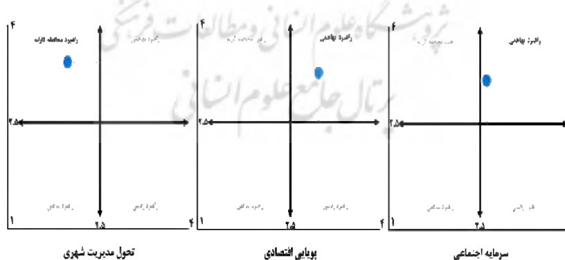
شکل ۳. راهبردهای چهارگانه توانمندسازی زنان سرپرست خانوار در سکونت‌گاه‌های غیررسمی

پس از آن براساس همه عوامل خارجی و داخلی (جدول سوات)، راهبردهای مناسب و مرتبط با موضوع تحقیق برای محلات هدف تدوین شد. شکل ۳ جایگاه هریک از معیارهای سه‌گانه را در نمودار راهبردها نشان می‌دهد. عوامل داخلی بر محور X ها و عوامل خارجی بر Yها قرار می‌گیرد. همان‌طور که ملاحظه می‌شود: