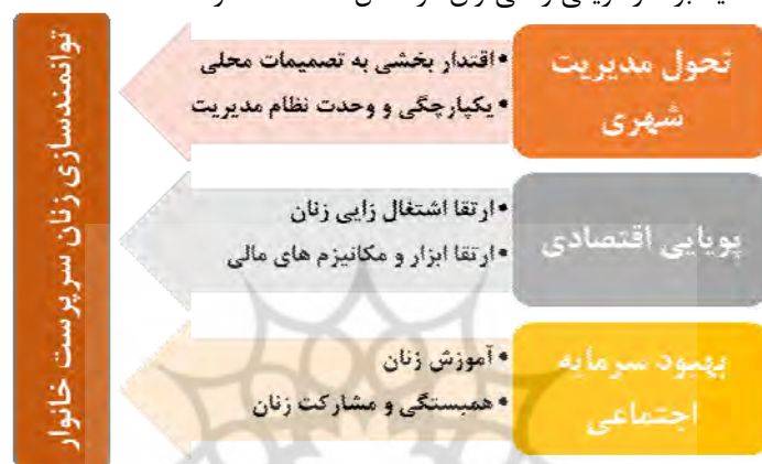
شکل ۱. چارچوب مفهومی توانمندسازی زنان سرپرست خانوار در سکونت‌گاه‌های غیررسمی با تأکید بر کارآفرینی

کسب‌وکارهای خرد به‌عنوان یک استراتژی کاهش فقر استفاده می‌شوند. چالش‌های مختلفی پیش روی زنان سرپرست خانوار جهت ورود و ماندن در عرصه کارآفرینی وجود دارد که از مهم‌ترین آن‌ها دسترسی‌نداشتن به منابع مالی و اعتبارات و فقدان دانش بازار است که با عدم پذیرش اجتماعی و عدم تعادل بین کارهای خانواده و کسب‌وکار مرتبط است (فلاح حقیقی ۱۳۹۴). به‌صورت کلی، عوامل تأثیرگذار در توانمندسازی زنان سرپرست خانوار در سکونت‌گاه‌های غیررسمی با تأکید بر کارآفرینی را می‌توان در شکل ۱ خلاصه کرد: