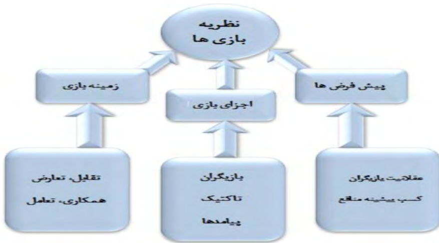
شکل ۱. ابزارهای تحلیل نظریه بازی‌ها