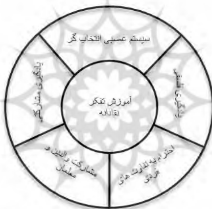
شکل ۱۰- مؤلفه‌های آموزش تفکر نقادانه

چون، اقتصادی، فرهنگی، اجتماعی و..... تعمیم داد و موضوعی برای پژوهش‌های آتی باشد. نقطه قوت رسانه‌های هوشمند در بحث یادگیری مشارکتی، و قدرت تأثیرگذاری بیشتر آن‌ها بر کودکان و نوجوانان است لذا به این گونه رسانه‌ها پیشنهاد می‌شود که با ویژگی ارزیابی کردن مفاهیم و شناخت پدیده‌ها، روند حل مسائل را با ریشه‌یابی عمیق و تجزیه و تحلیل کردن آنها برای کودکان و نوجوانان تشریح کند و توانایی ایجاد روحیه جستجوگری و انگیزه مسأله‌یابی و حل آن را در یادگیرندگان به وجود آورد و مهم‌ترین نتیجه آموزشی حاصل از تفکر نقادانه به ایجاد قدرت بیان و فن نقادی کمک می‌کند و تحمل درک دیدگاه‌های مخالف را در آنان به وجود می‌آورد.