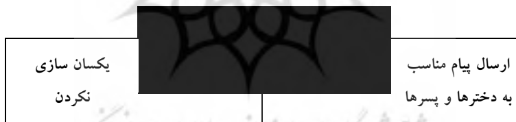
شکل ۴- احترام به تفاوت‌های فردی و تبعیت نکردن از سیاست یکسان سازی

از مفاهیمی که در کدگذاری باز استخراج شده بود، احترام به تفاوت‌های فردی کودکان و نوجوانان بود که در کدگذاری محوری داده‌ها، این مفهوم را به عنوان زیر مقولات مقوله اصلی نقش رسانه هوشمند در آموزش تفکر نقادانه به کودکان و نوجوانان طبقه‌بندی کردیم تا به این طریق ابعاد مختلف این مفهوم را تبیین نماییم. این مقوله‌ها شامل ارسال پیام مناسب به دخترها و پسرها، یکسان‌سازی نکردن بود.